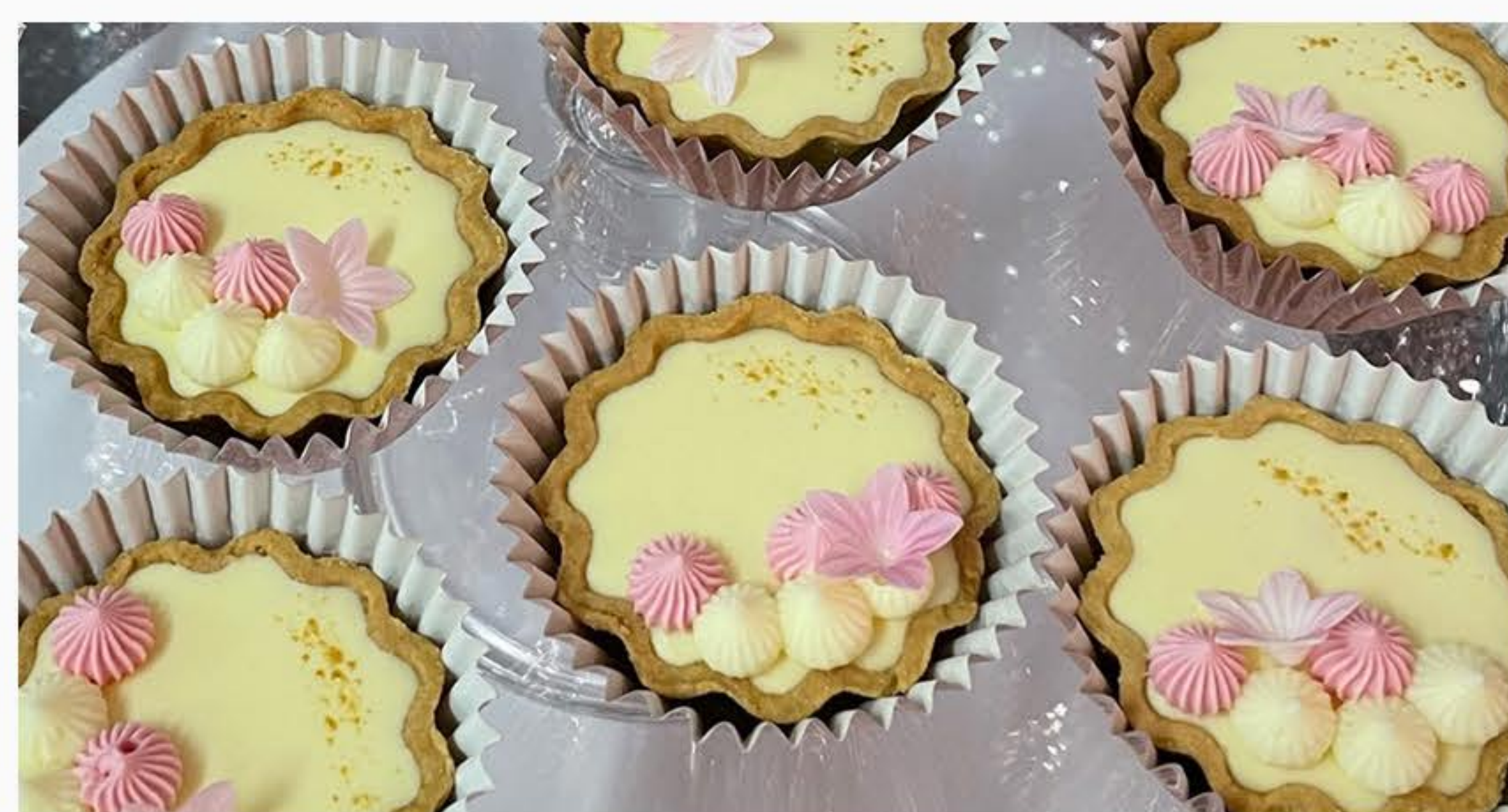
MUS AJERKONIAKOWY Z NUTĄ POMARAŃCZY