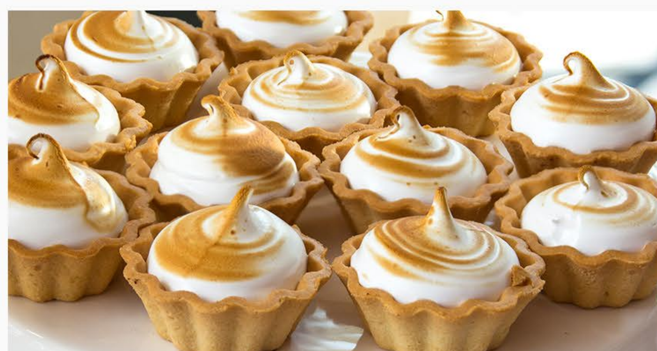
LEMON CURD Z OPALANĄ BEZĄ