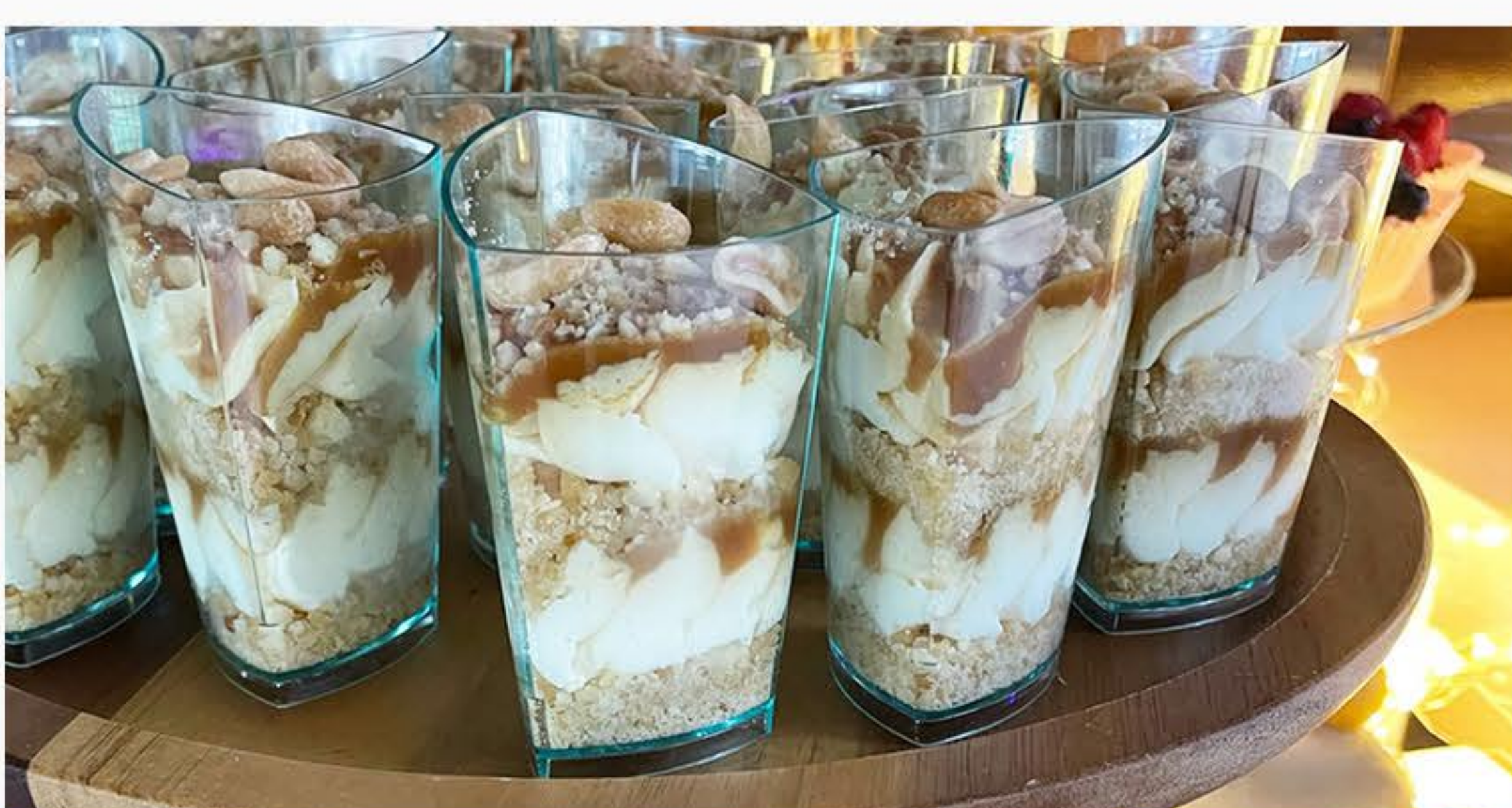
SŁONY KARMEL Z MASCARPONE I ORZESZKAMI