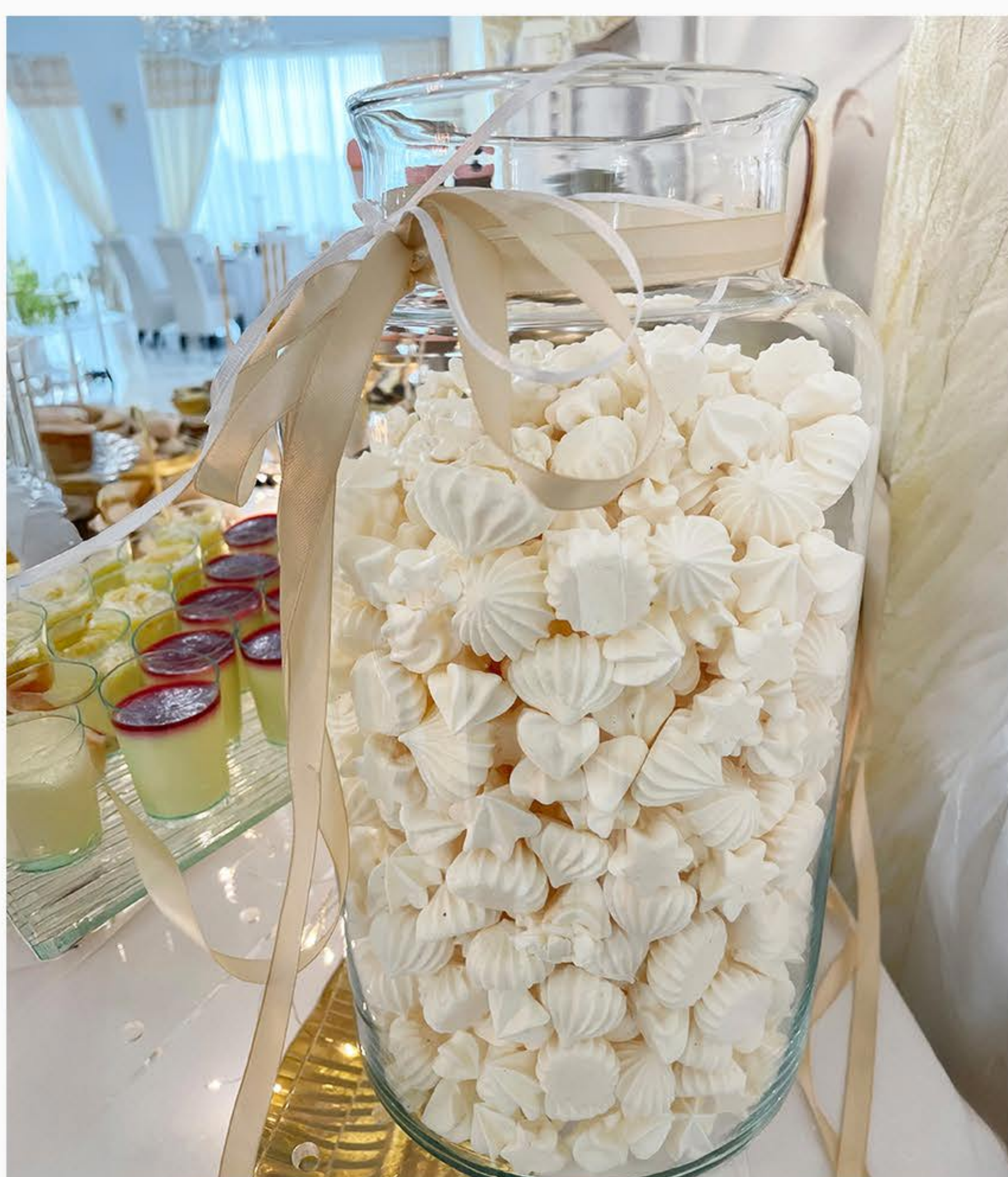
BEZY W SŁOJU (OK. 1,5 KG)