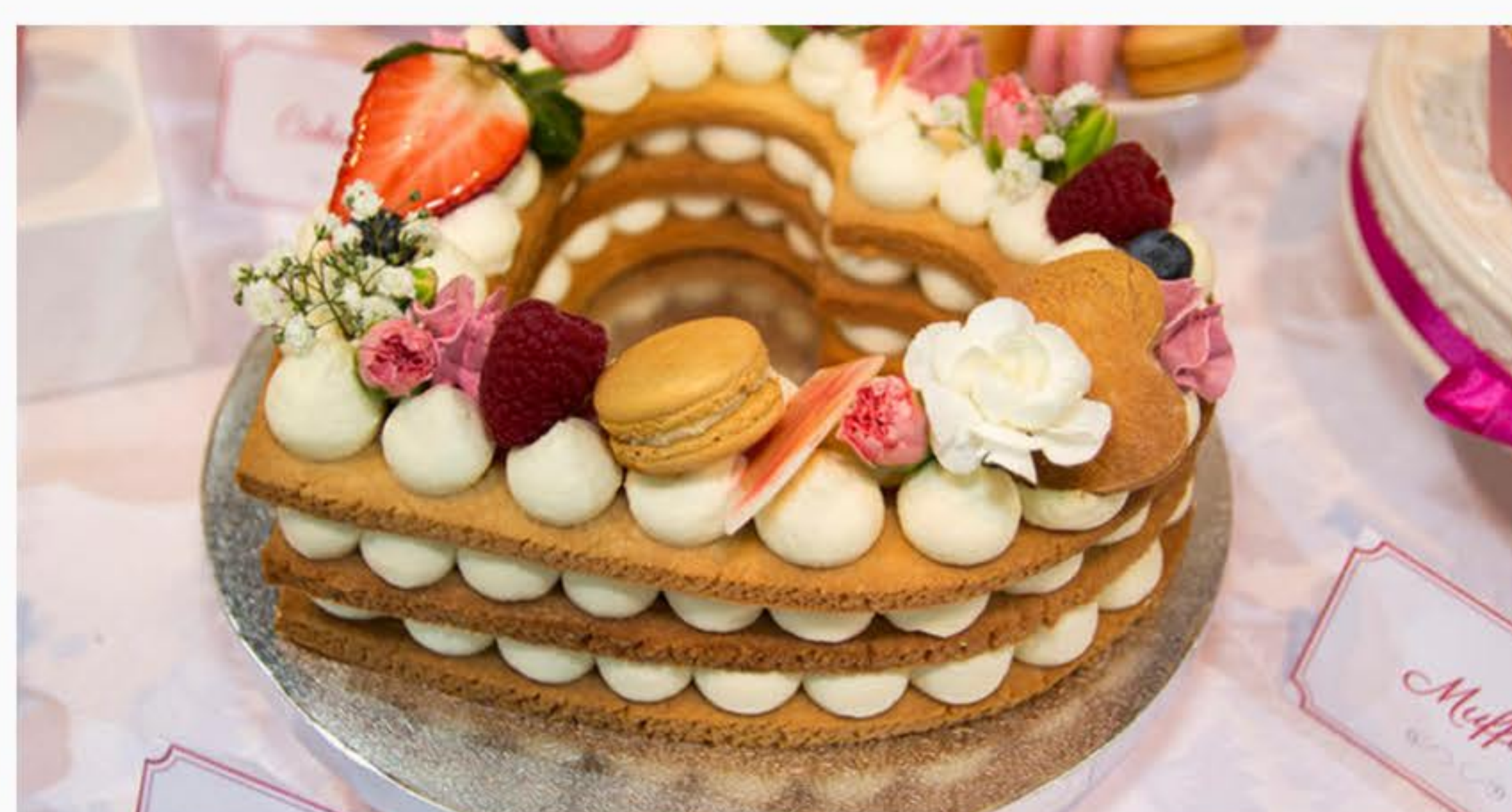
KRUCHE Z MASCARPONE I OWOCAMI