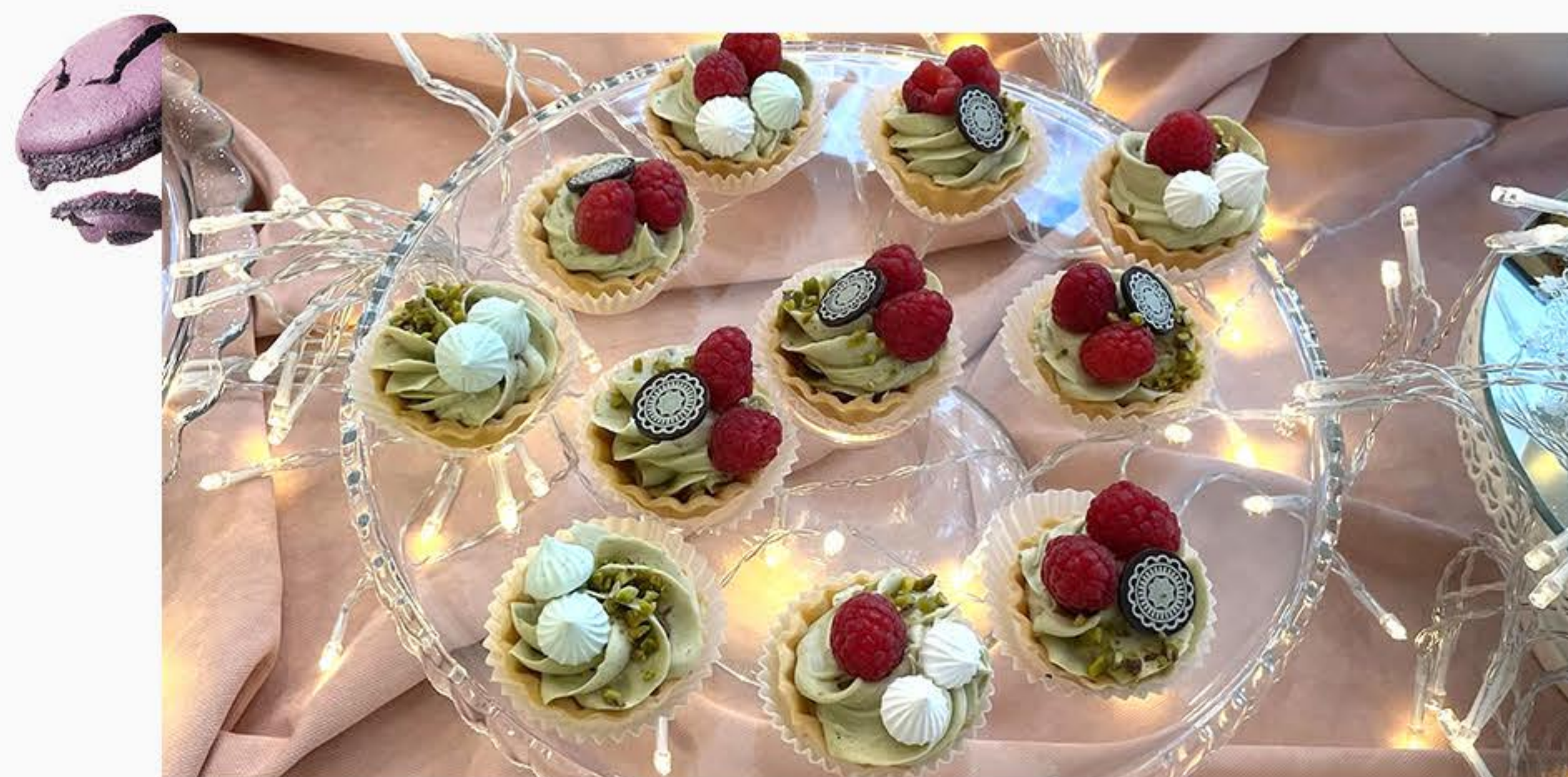
TARDALETKA Z PISTACJĄ