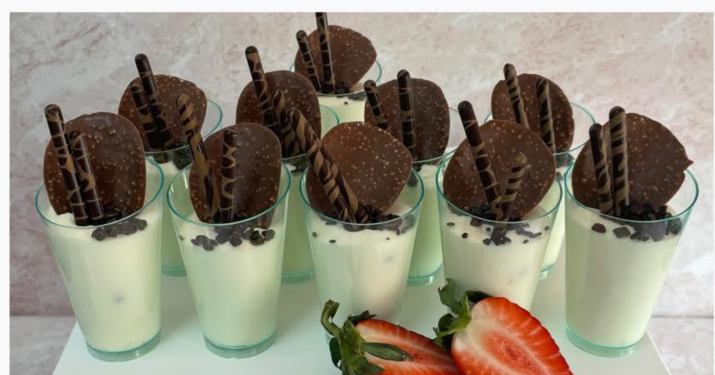
MUS Z BIAŁEJ CZEKOLADY