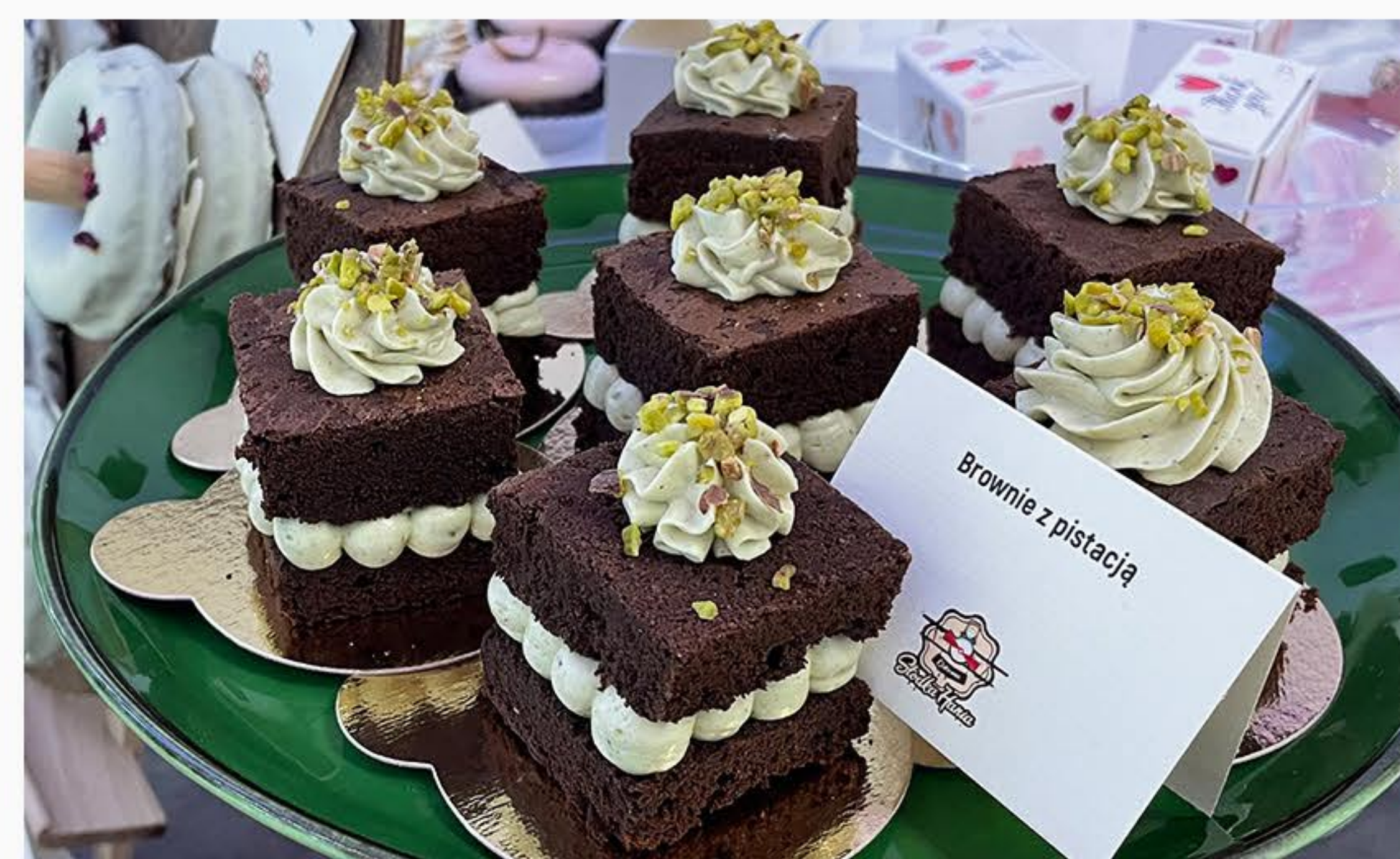
BROWNIE Z PISTACJAMI