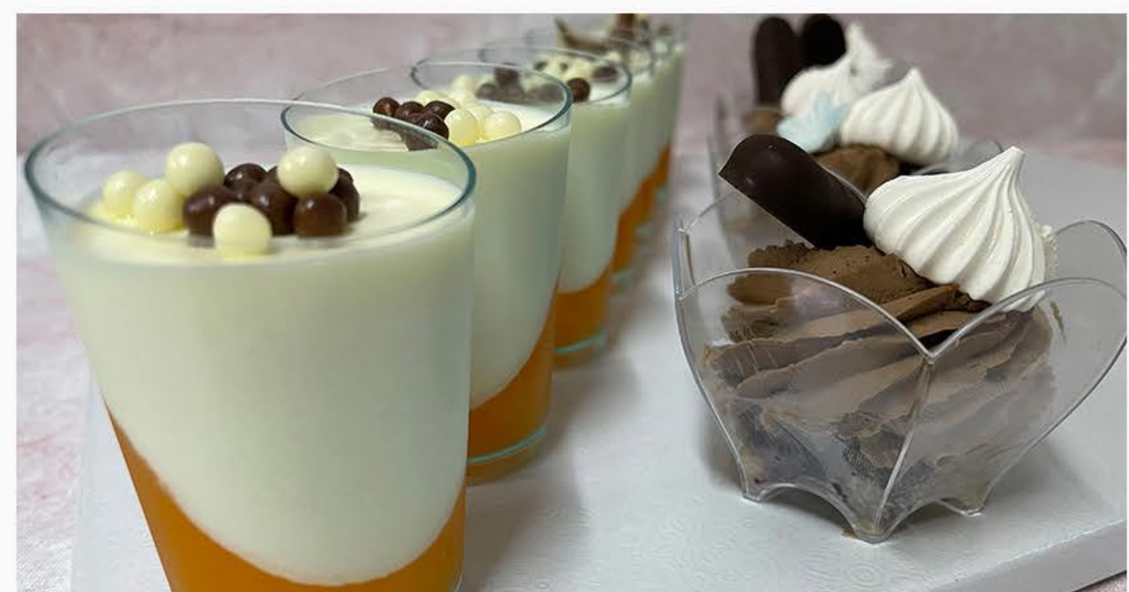
PANNA COTTA Z BRZOSKWINIĄ