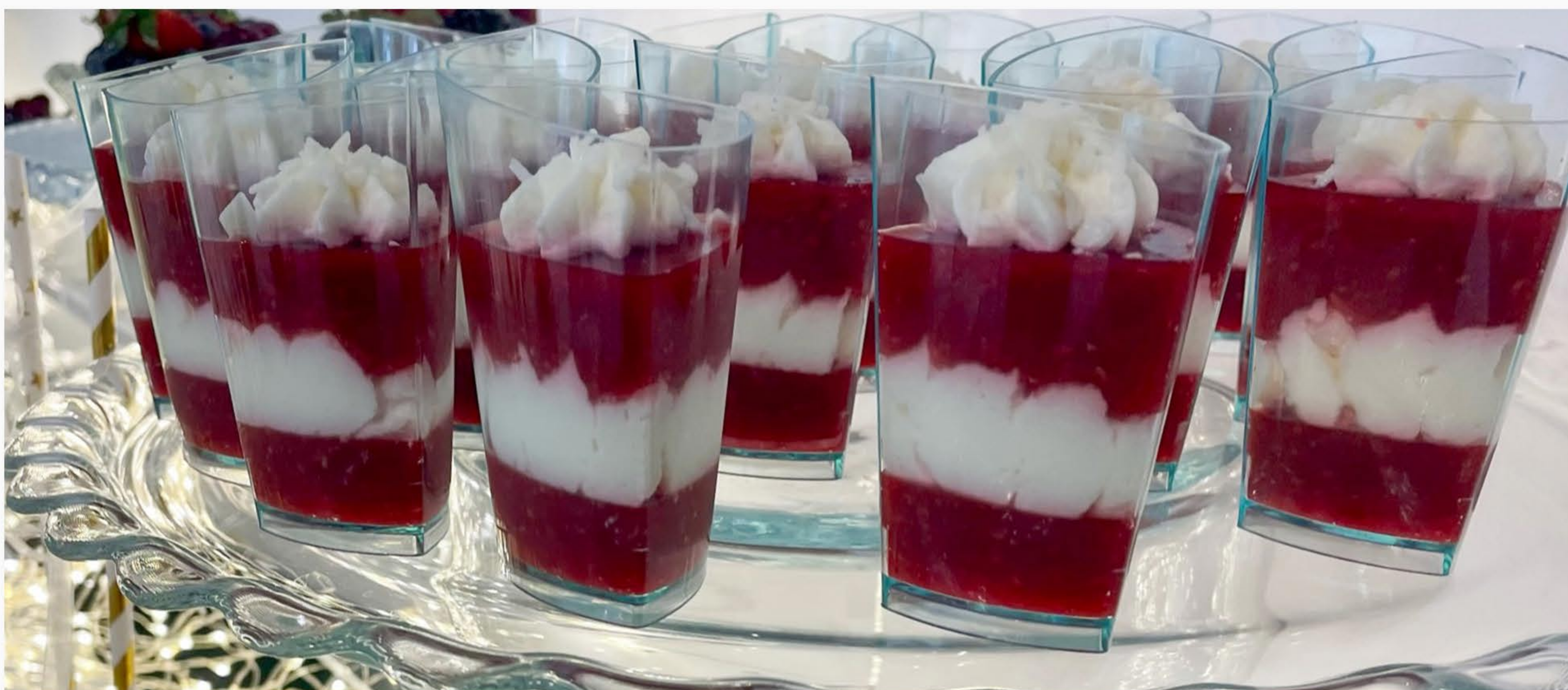
NATURALNA GALARETKA MALINOWA Z BITĄ ŚMIETANKĄ (OK. 70ML)