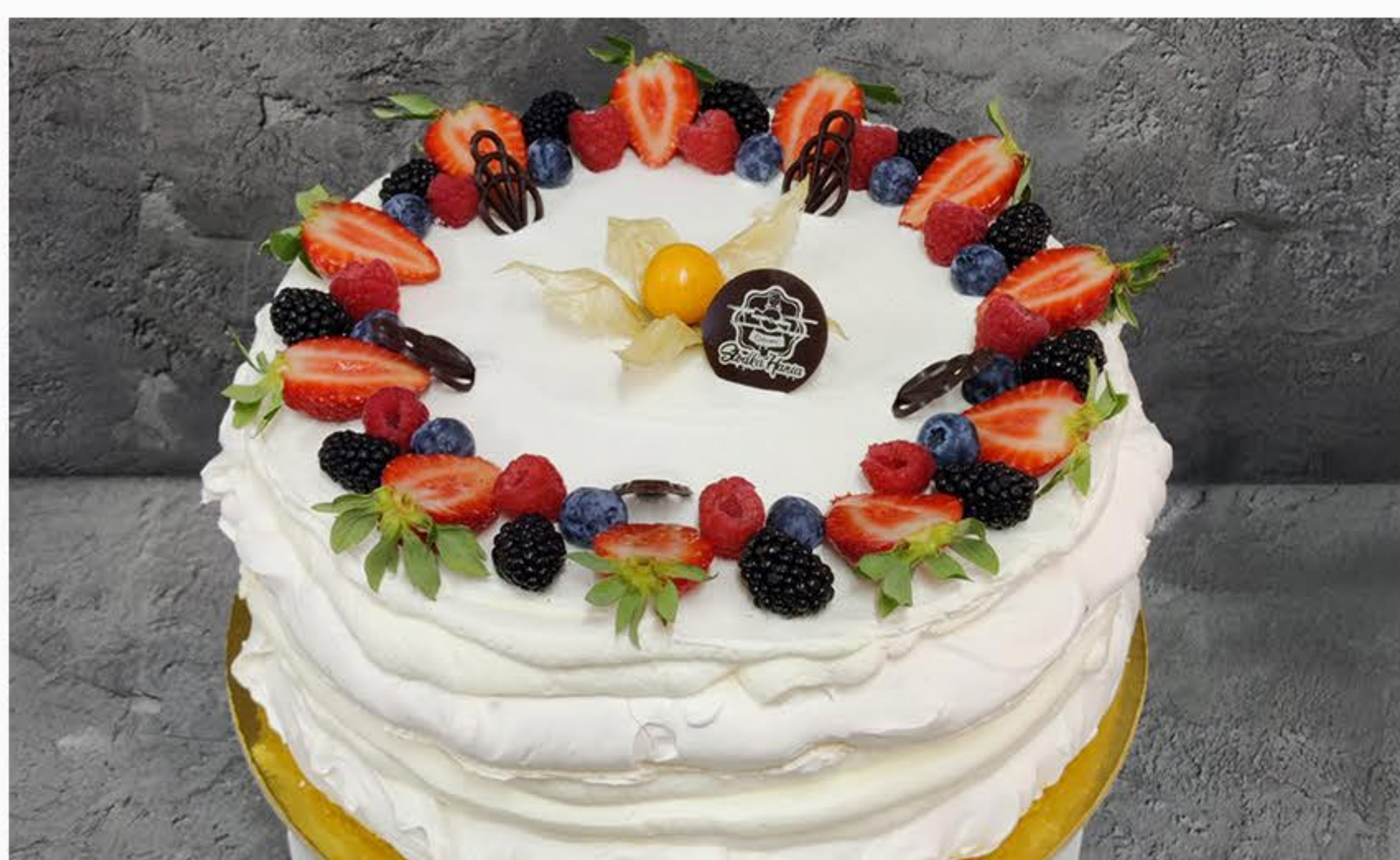
BEZA Z MASCARPONE I OWOCAMI (24CM)