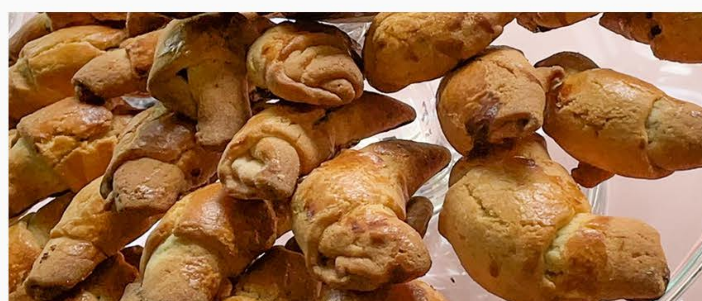
ROGALIKI Z WIŚNIĄ