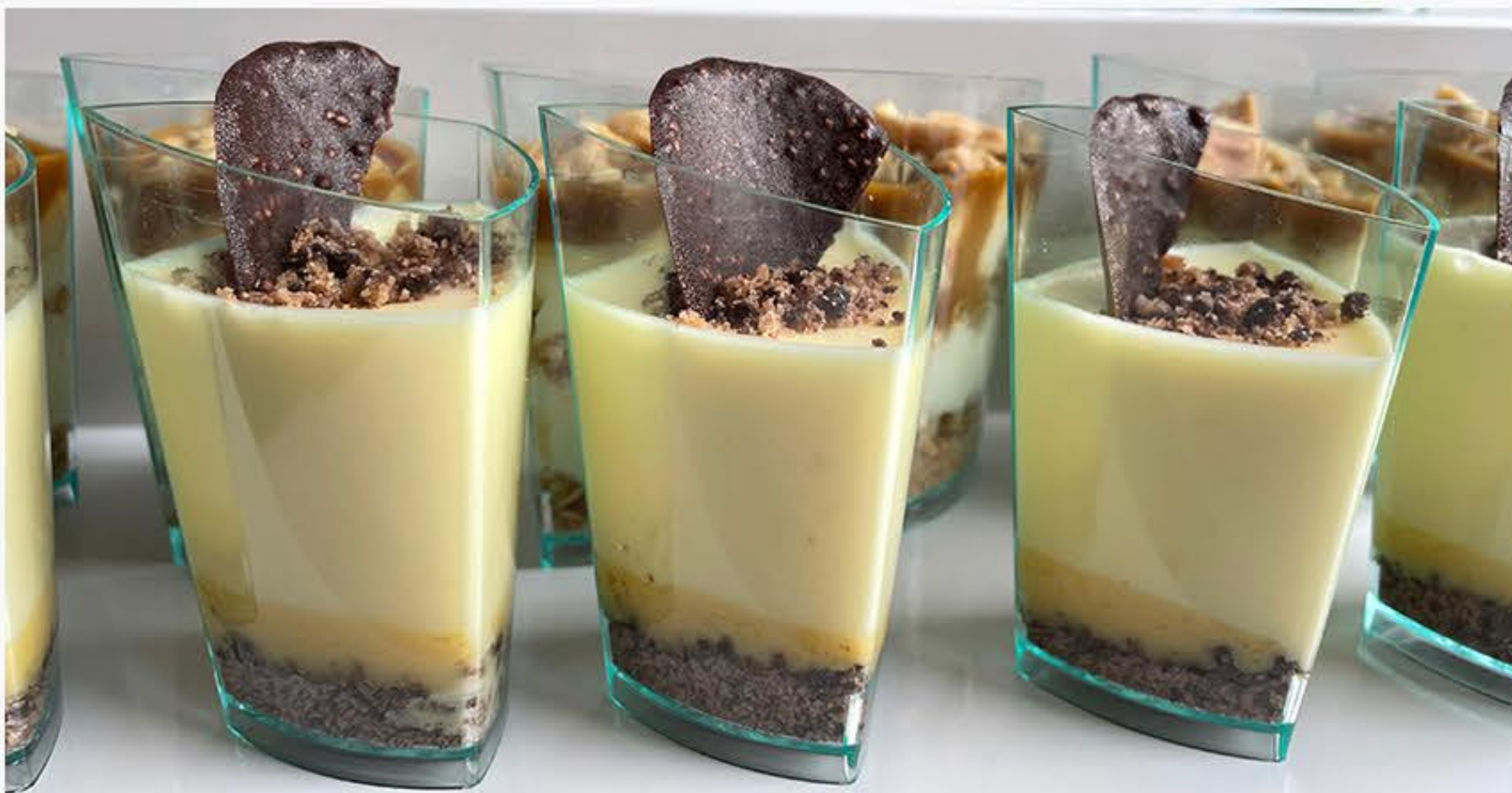
ADWOKATKA Z POMARAŃCZĄ