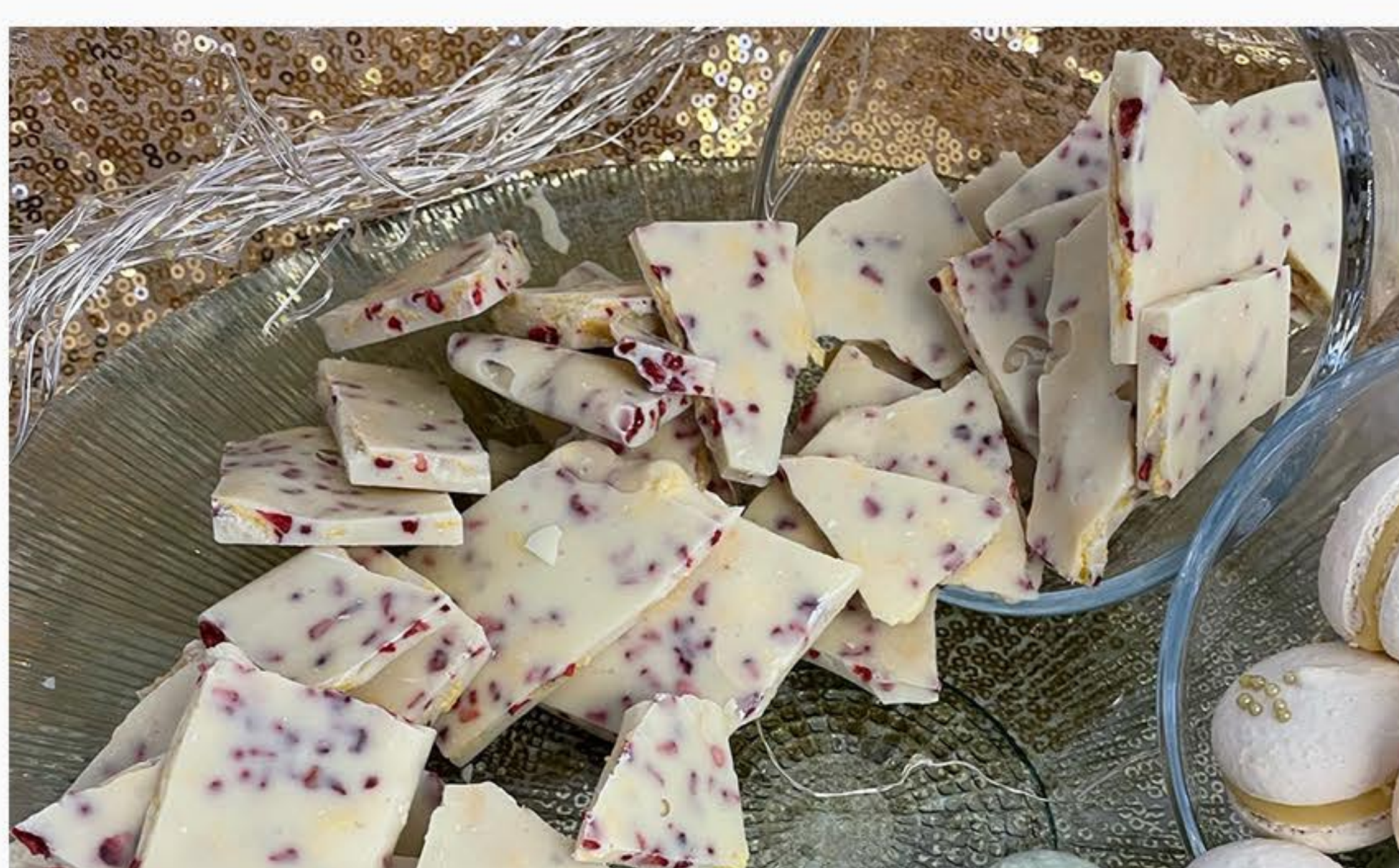
BIAŁA CZEKOLADA Z PRAŻONYM ZIARNEM I MALINAMI