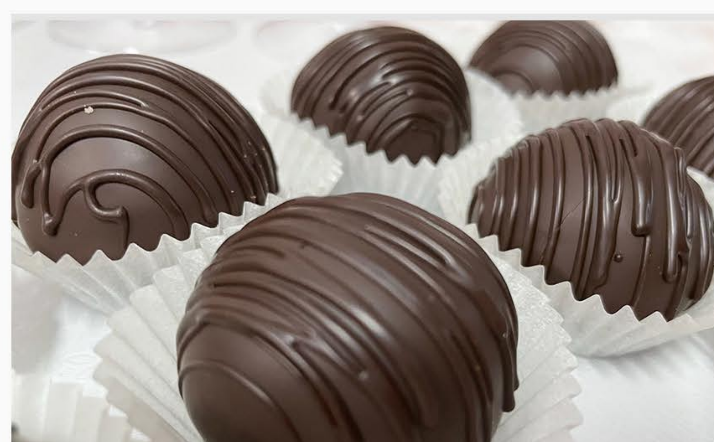
TRUFLA PIJANA ŚLIWKA