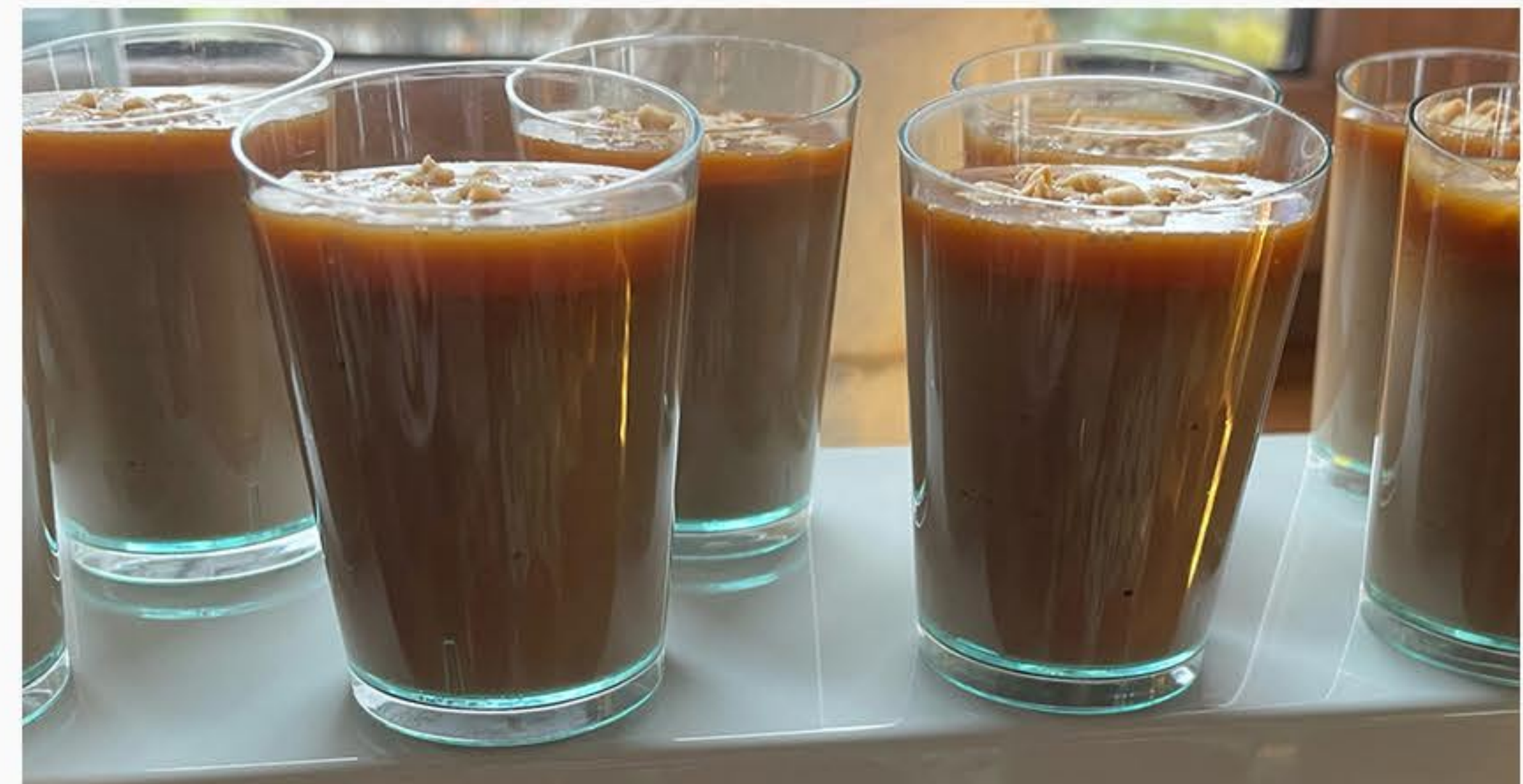
MUS CZEKOLADOWY I SŁONY KARMEL