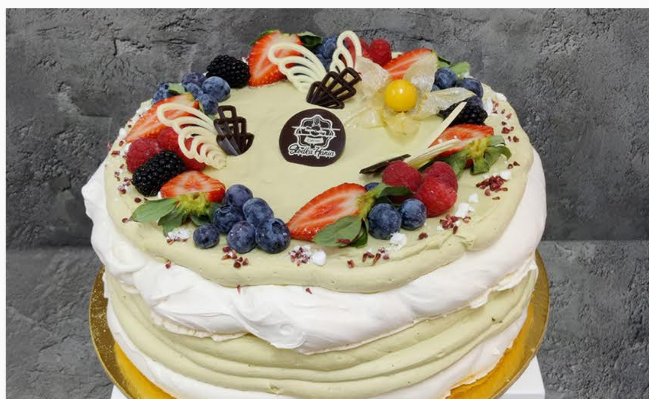
BEZA PISTACJOWA (24CM)