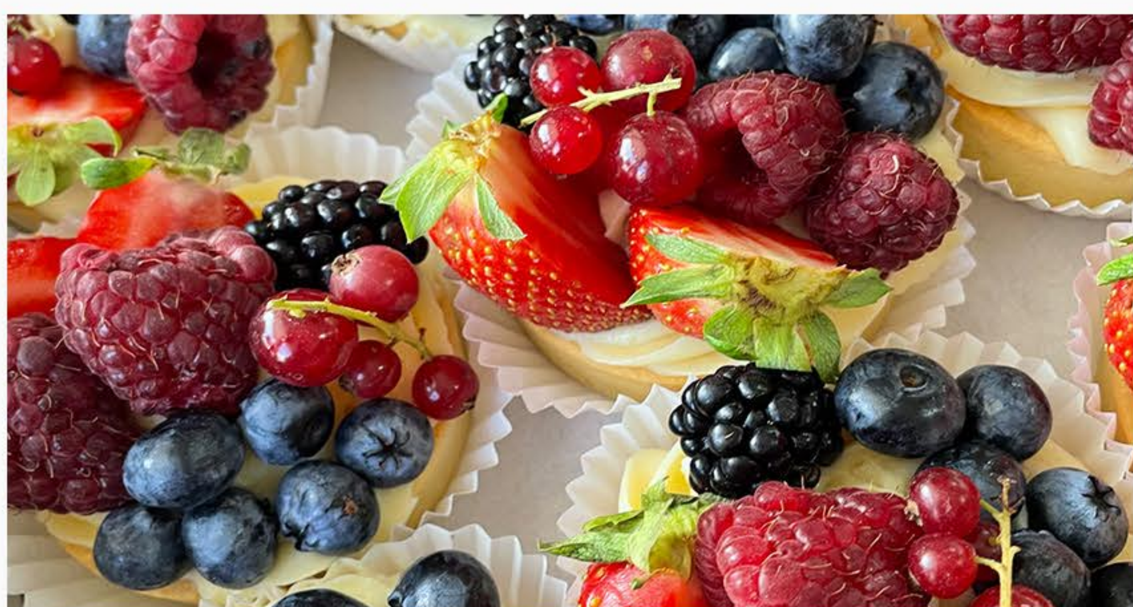
KREM BUDYNIOWY Z MUSEM OWOCOWYM