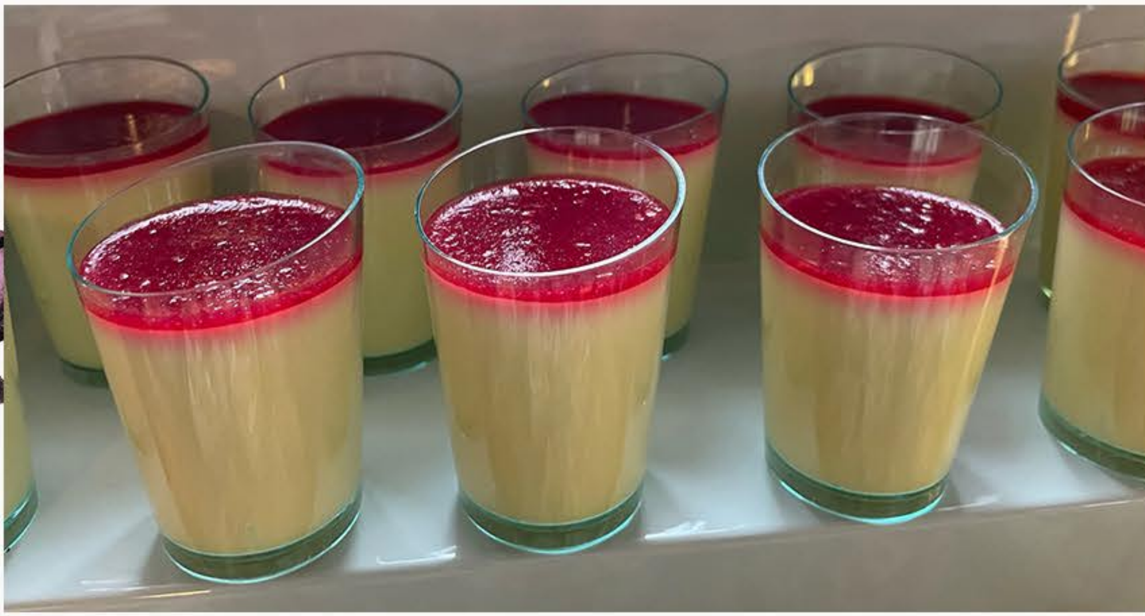
MUS MARAKUJA Z NUTĄ MALINY