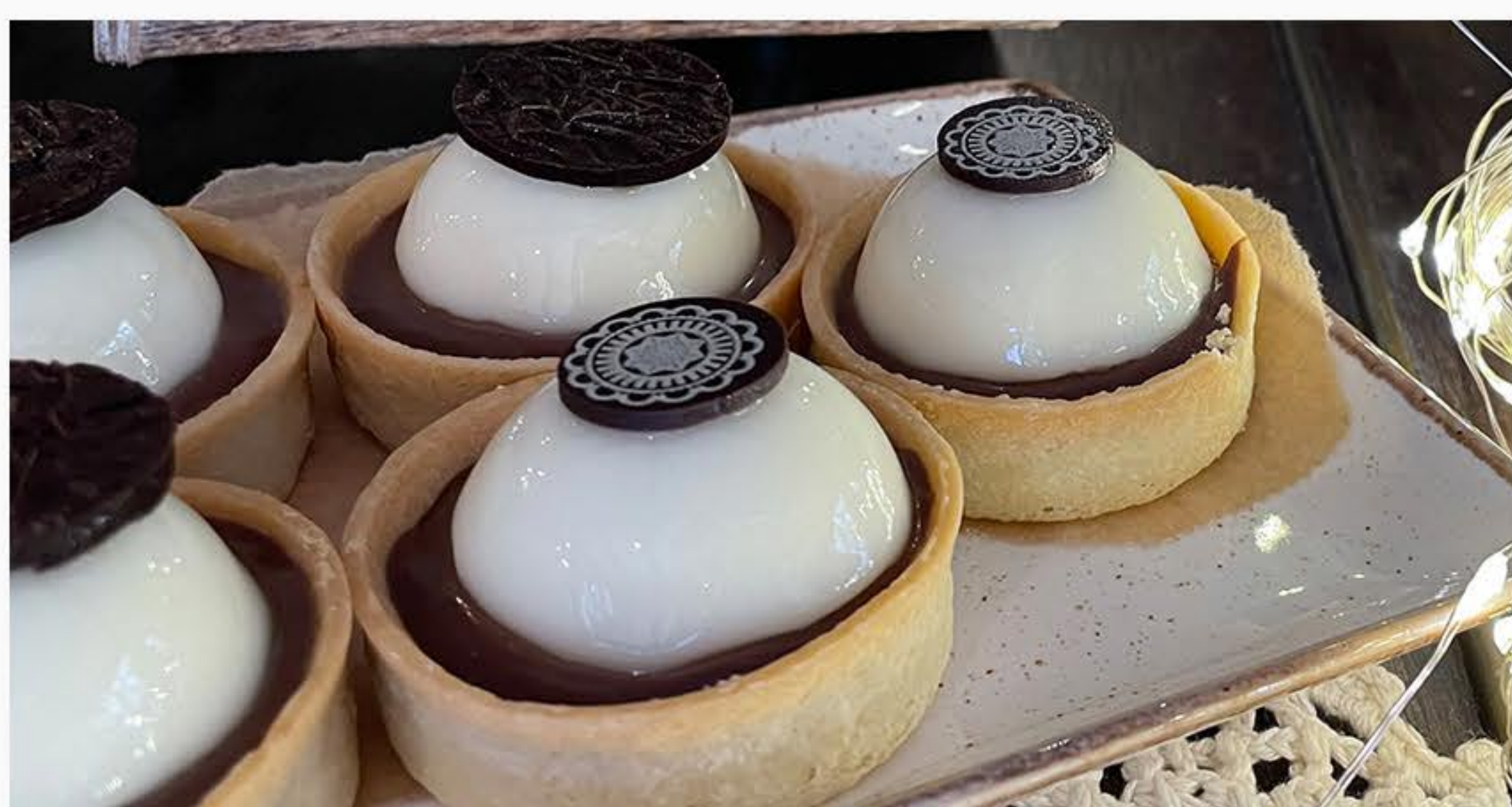
GENACH CZEKOLADOWO/POMARAŃCZOWY Z MUSEM JOGURTOWYM