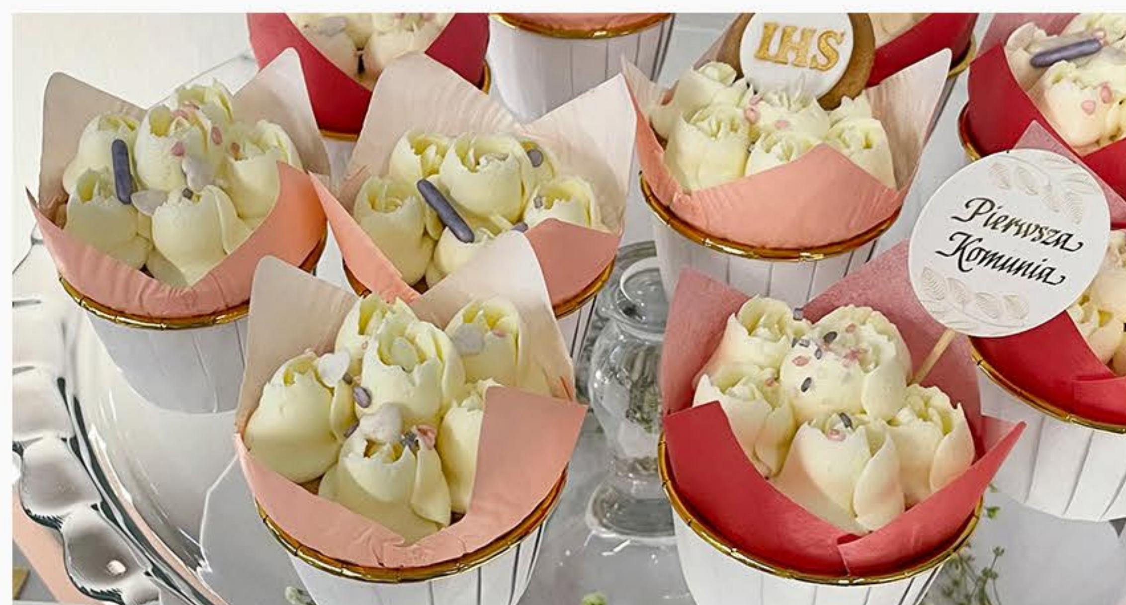
Muffin z kremem śmietankowym