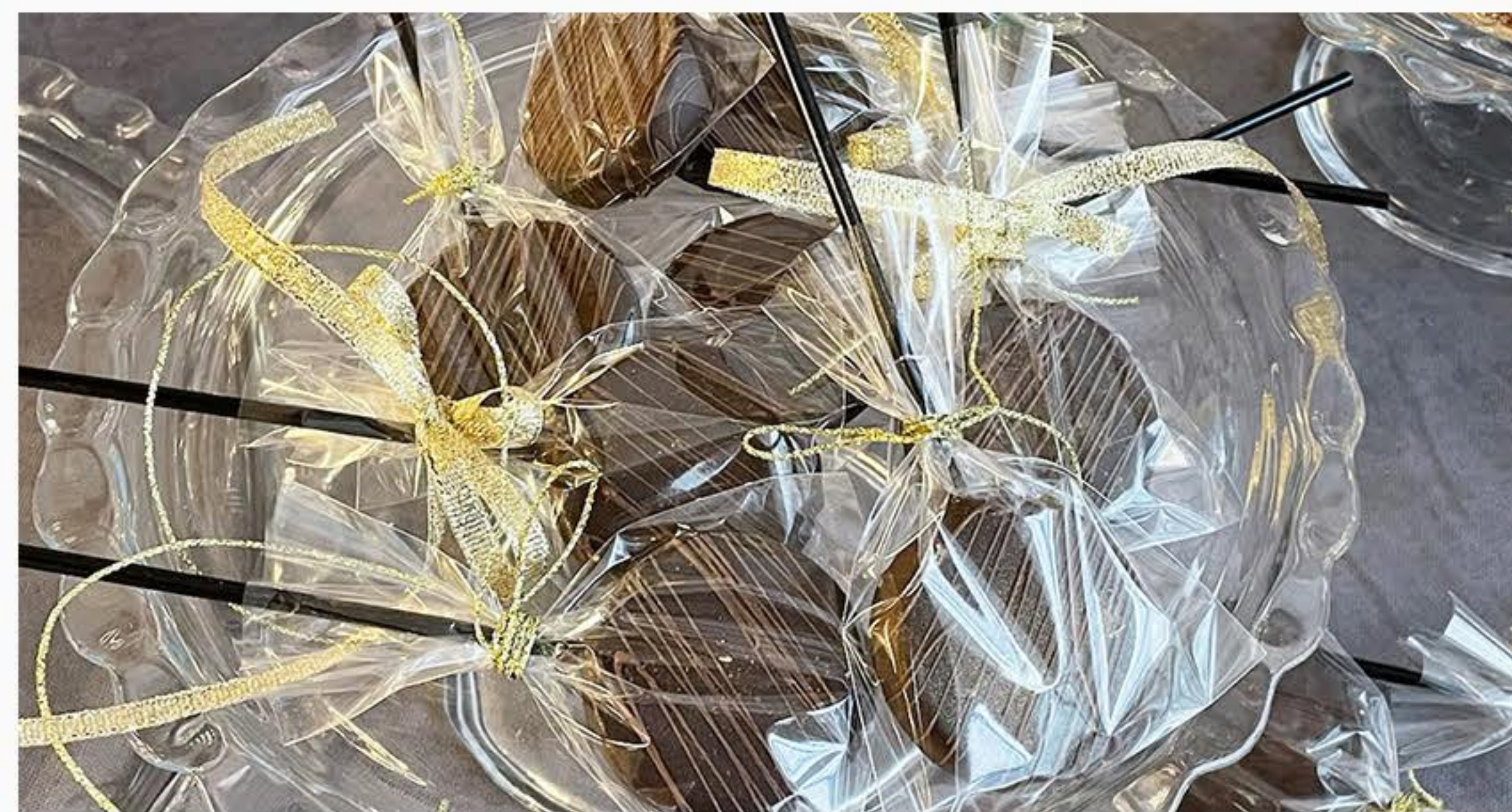
CHRUPAK W CZEKOLADZIE