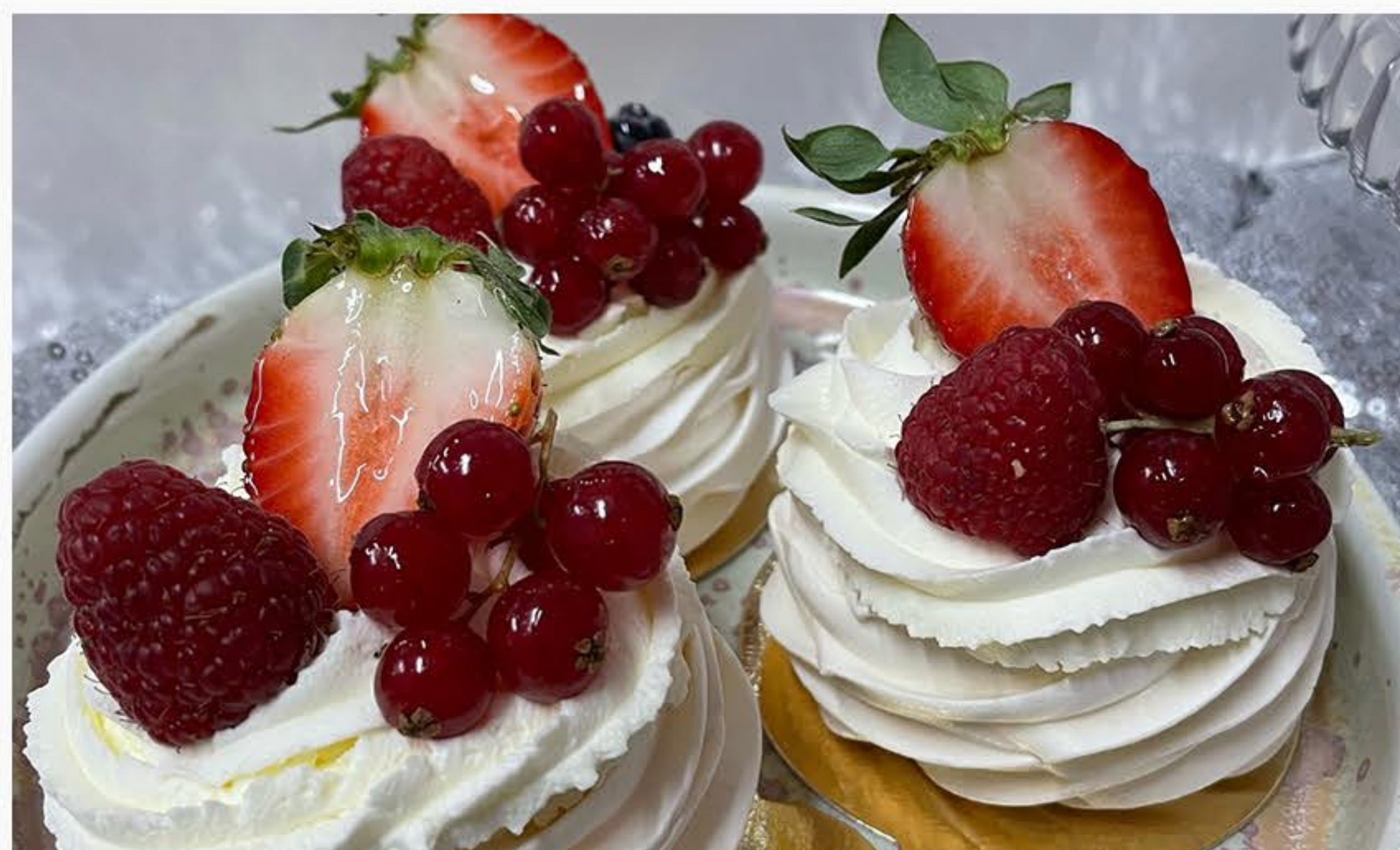
BEZA Z MASCARPONE I OWOCAMI