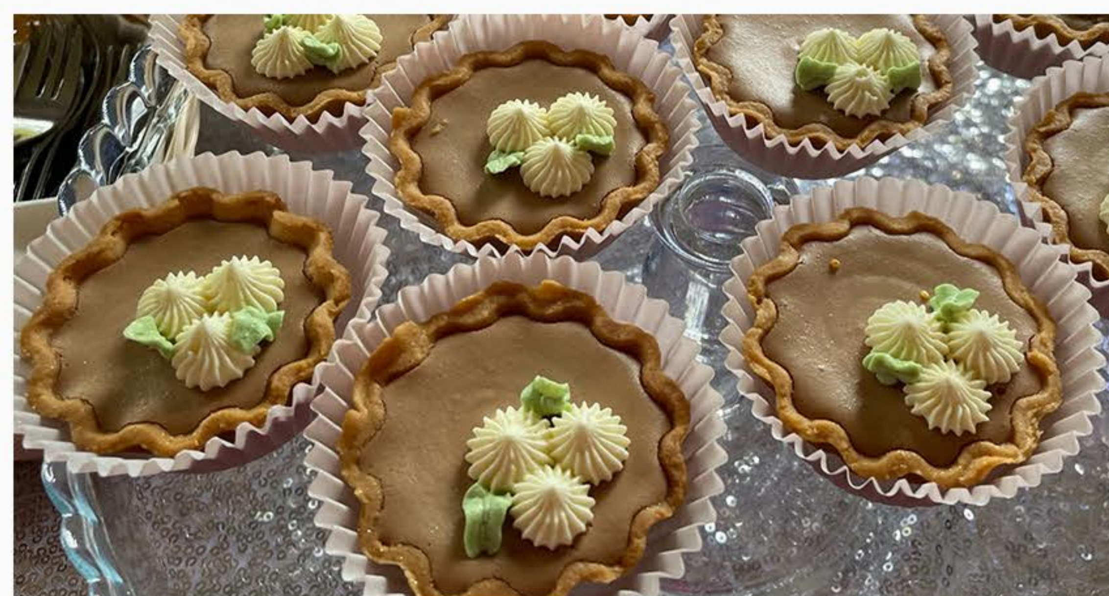
MIGDAŁOWE Z KREMEM CZEKOLADOWYM