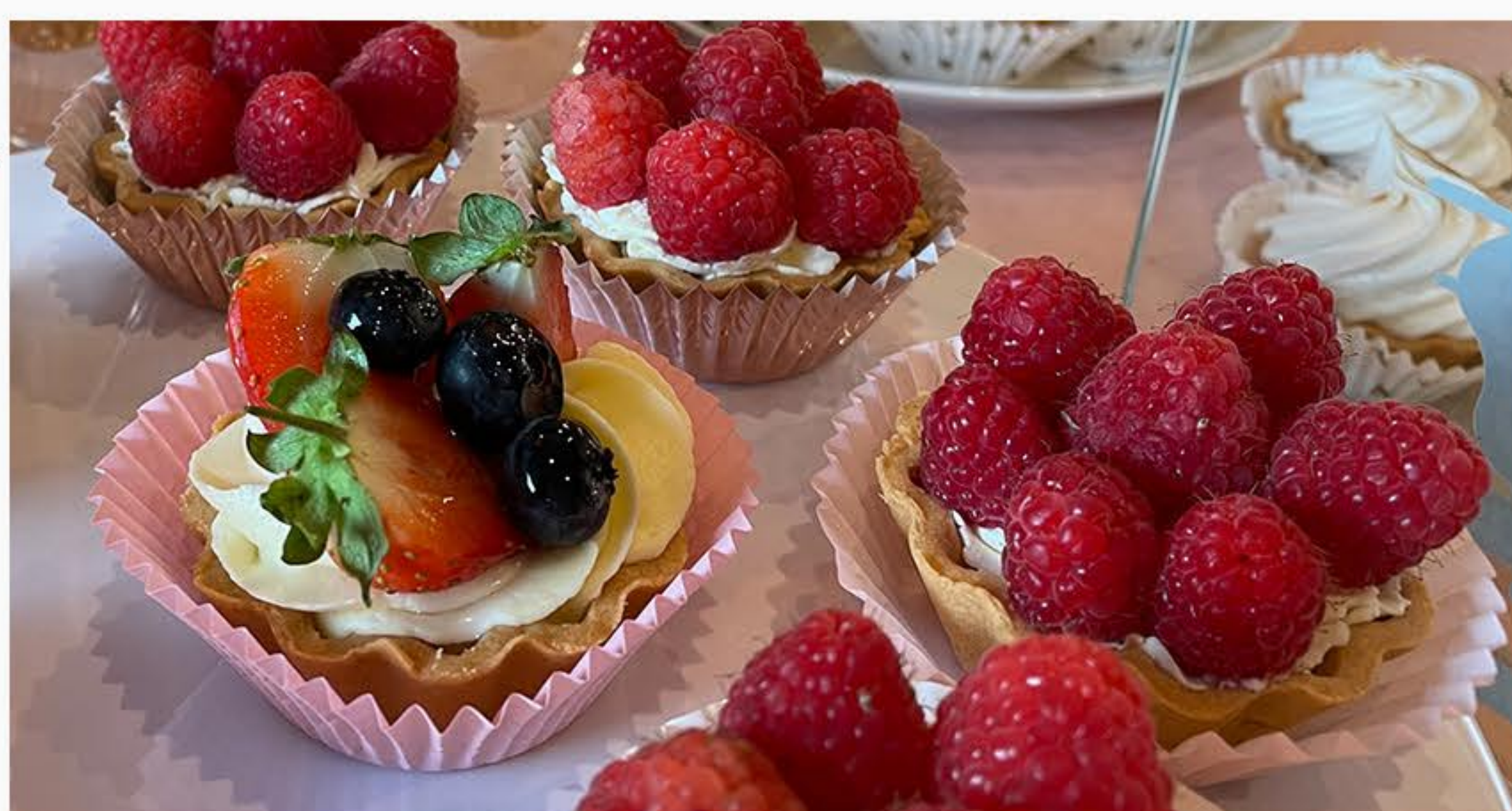
MASCARPONE * Z MALINAMI