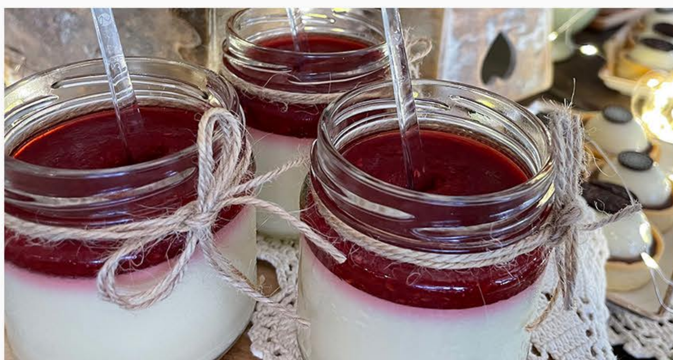
DESER W SŁOICZKU