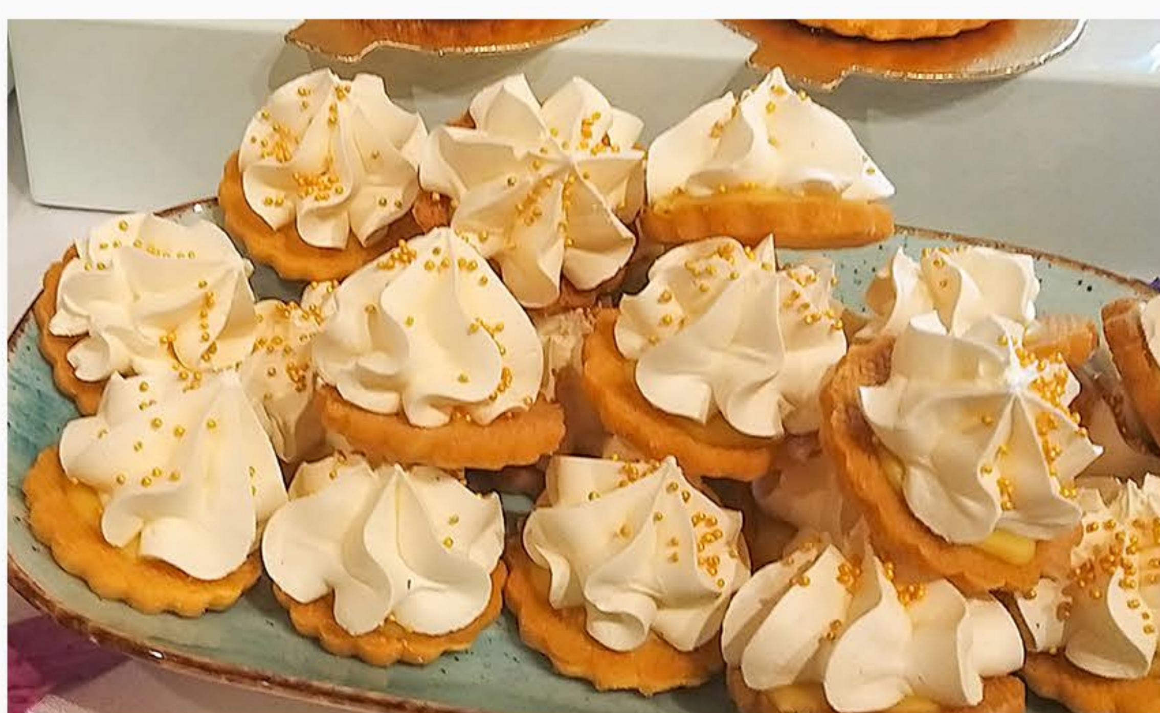
CIASTECZKO KRUCHE BEZIK I MARAKUJA