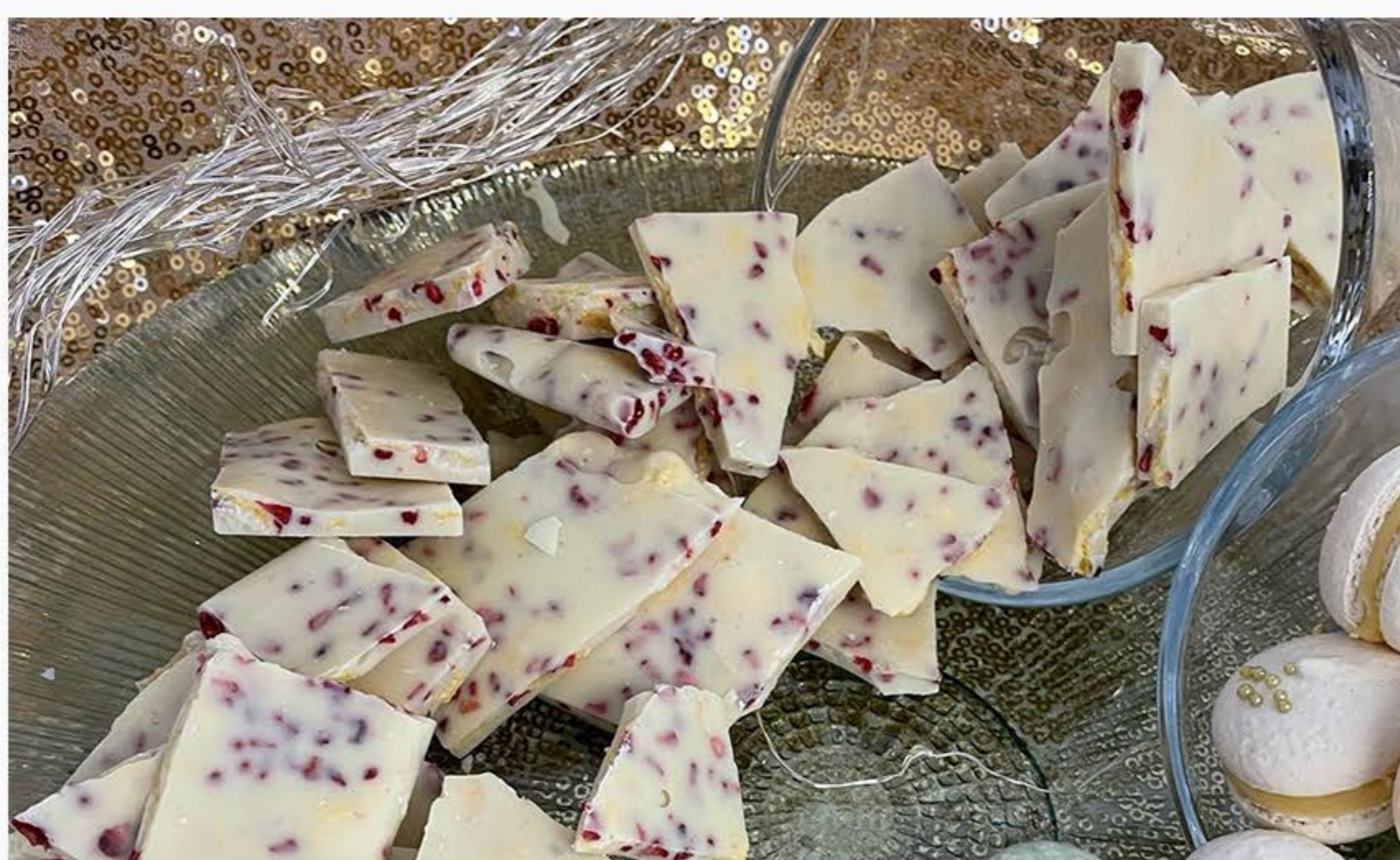
BIAŁA CZEKOLADA Z PRAŻONYM ZIARNEM I MALINAMI