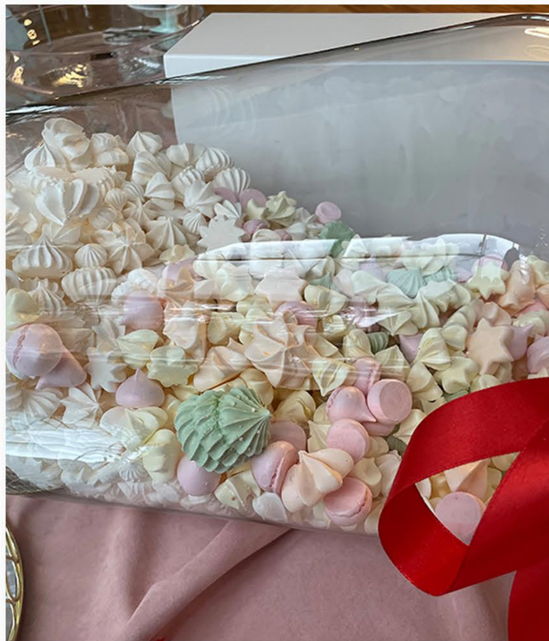
BEZY W SŁOJU (OK. 1,5 KG)