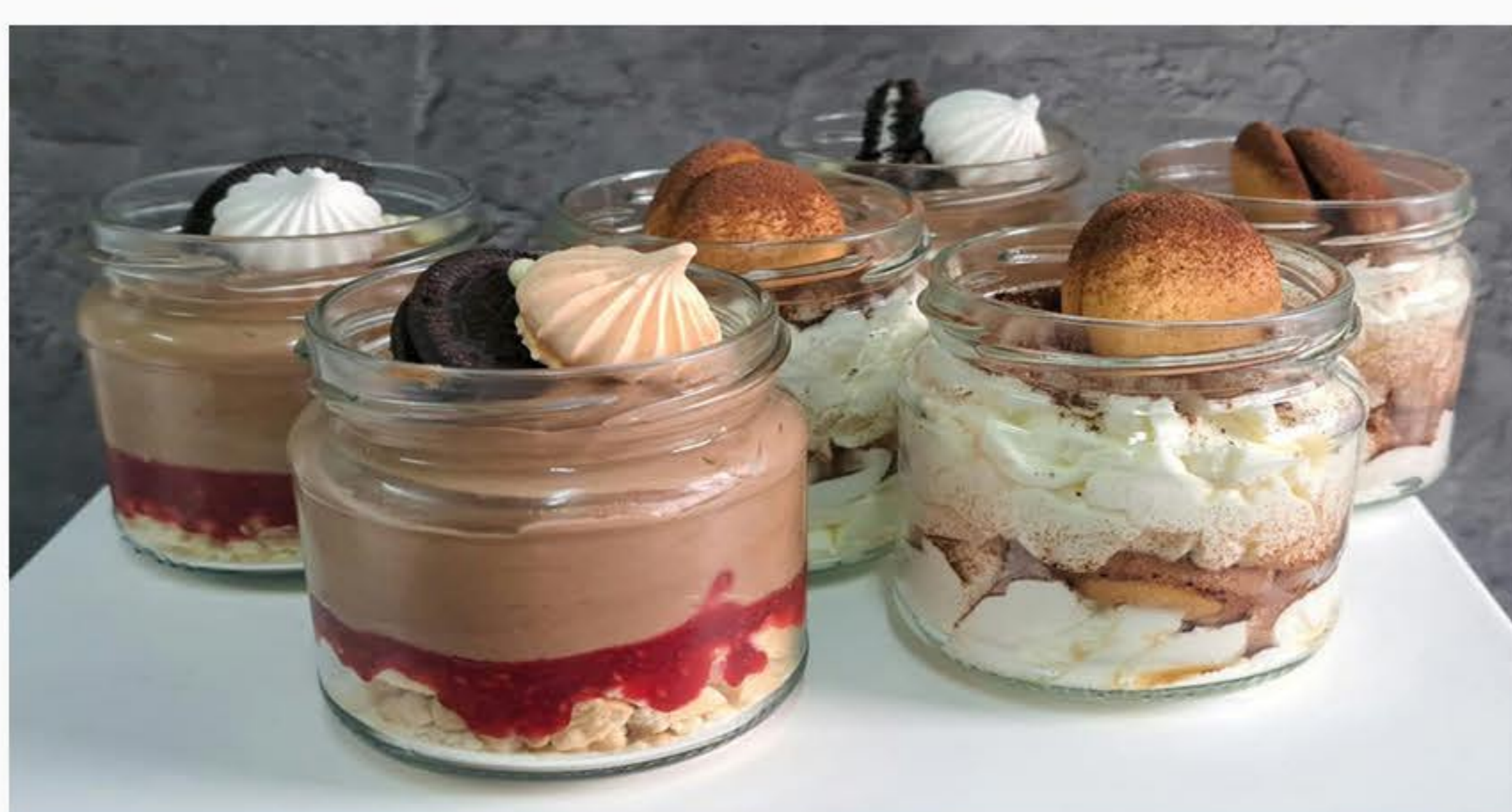
DESER W SŁOICZKU