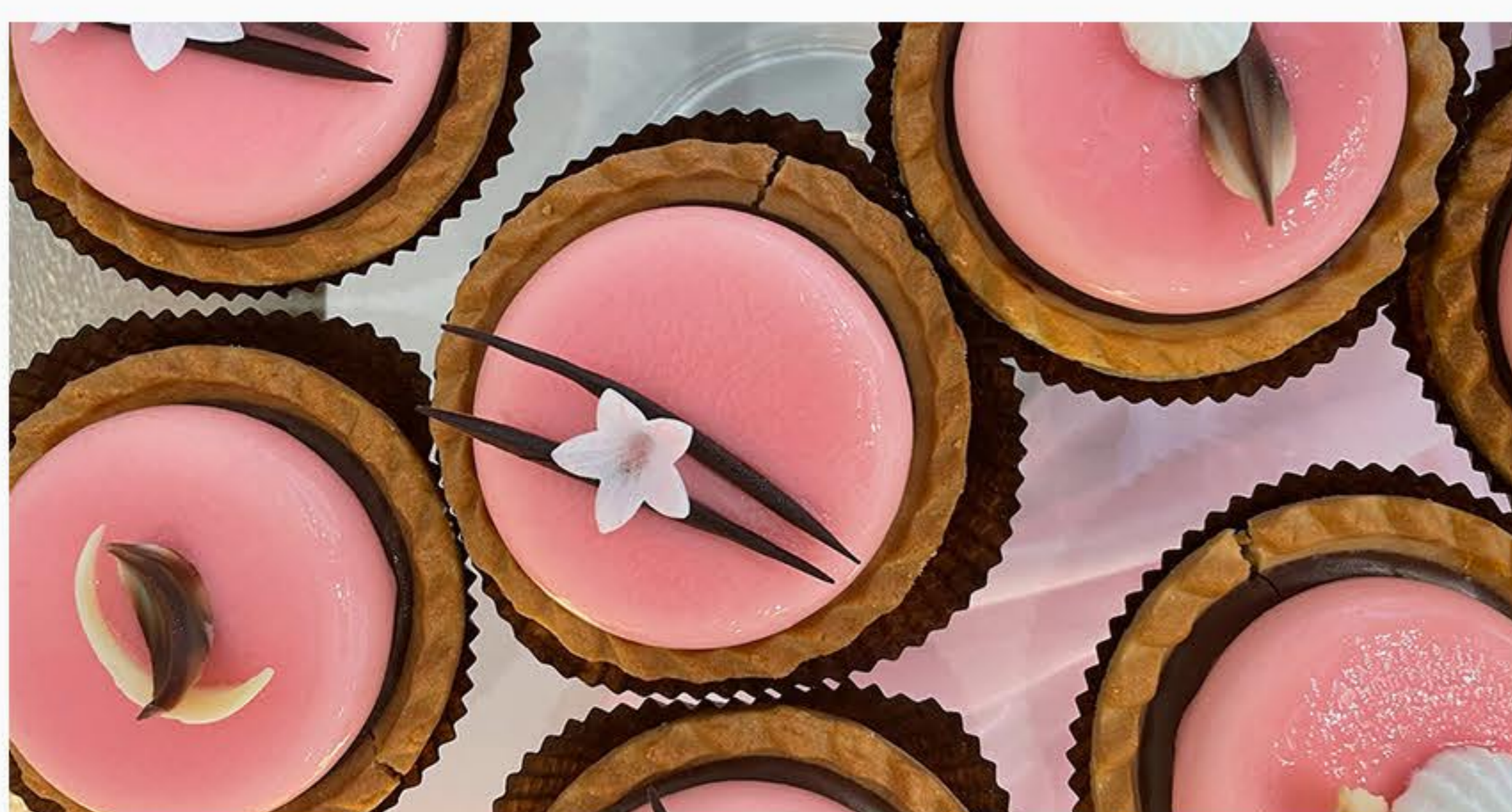
GENACH CZEKOLADOWO/POMARAŃCZOWY Z MUSEM JOGURTOWYM