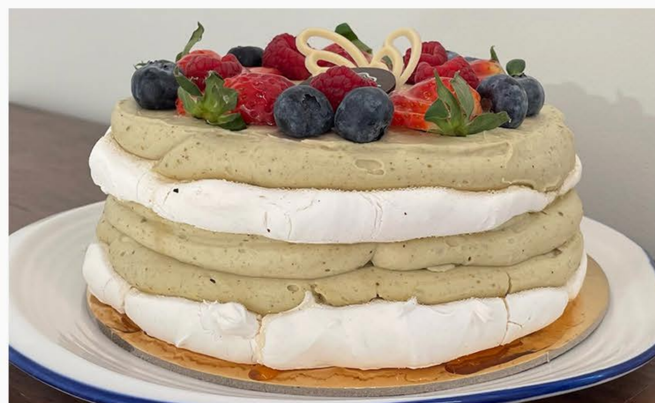
TORT BEZOWY Z PISTACJĄ 130zł/kg