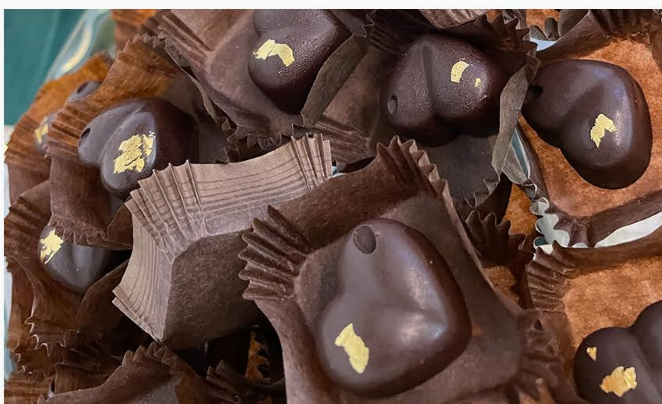
PRALINKA KOKOSOWA 10zł/100g

Trufła pijana śliwka - ok. 30 szt. w 1 kg, Pralina kokosowa i pistacjowa - ok. 80szt. w 1kg.