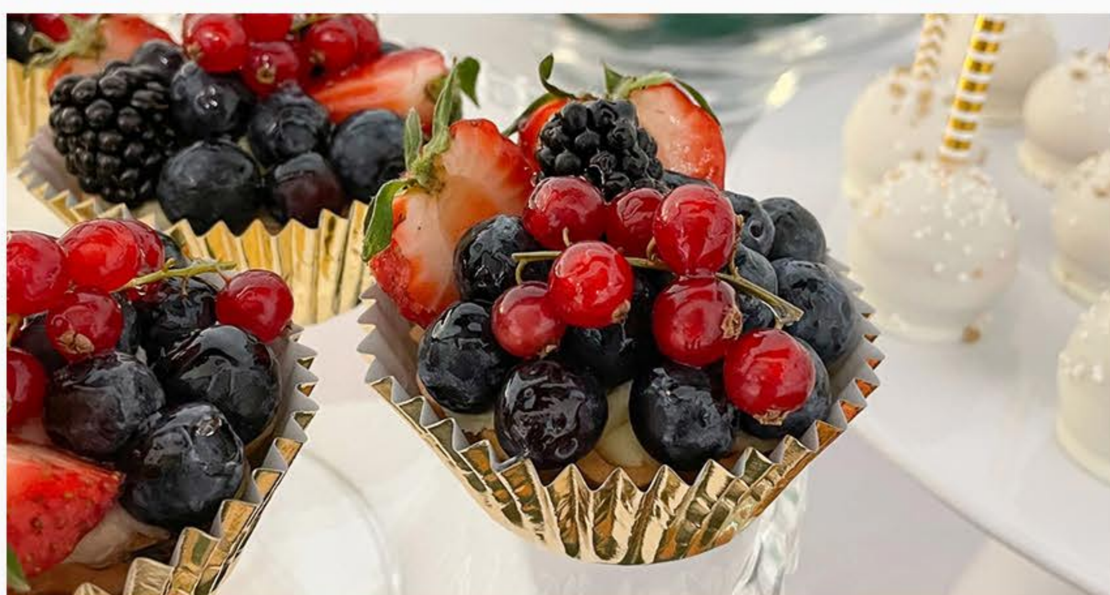
KREM BUDYNIOWY Z MUSEM OWOCOWYM