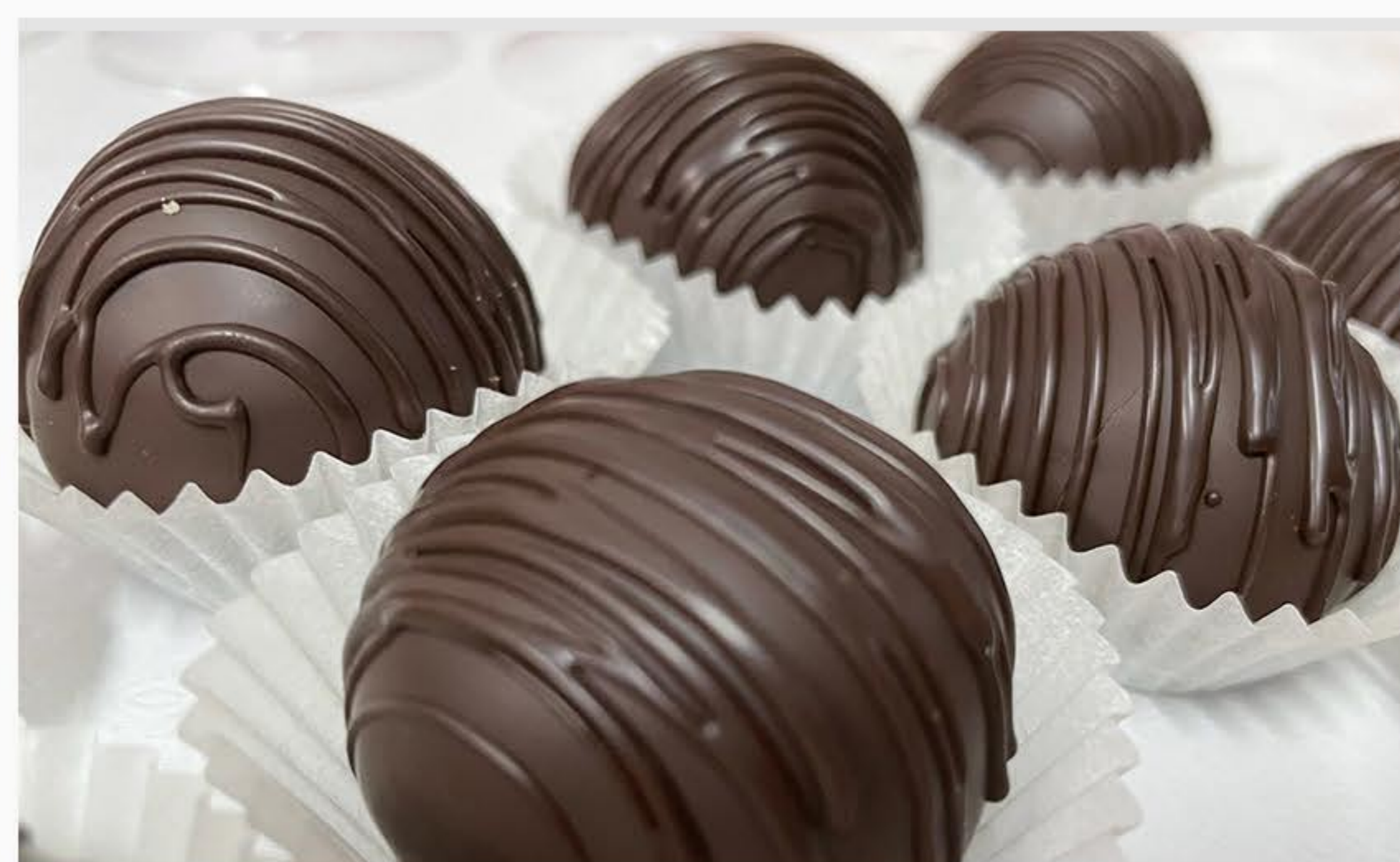
TRUFLA PIJANA ŚLIWKA