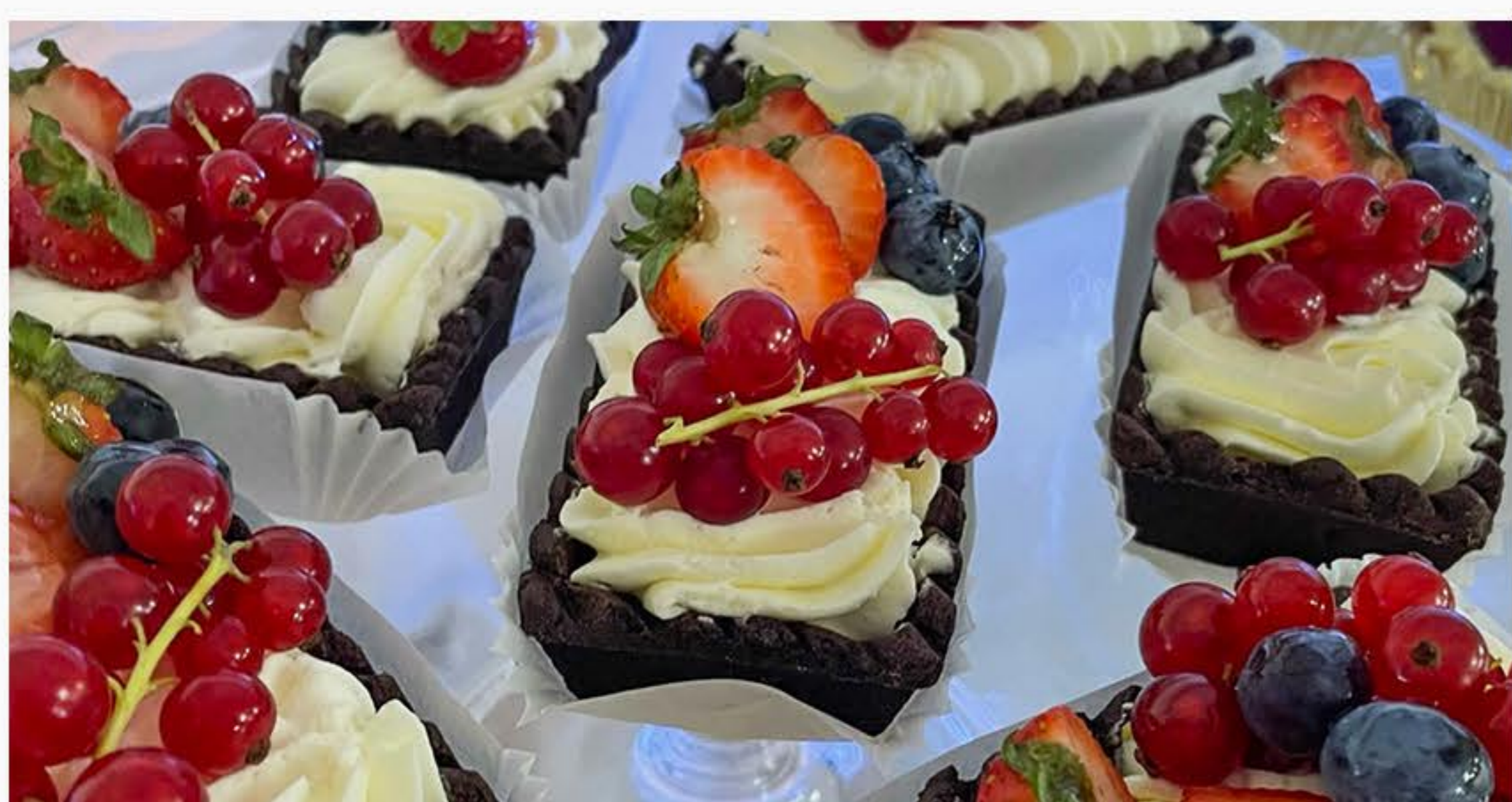
Z BITĄ ŚMIETANKĄ I OWOCAMI (100 X 50MM)