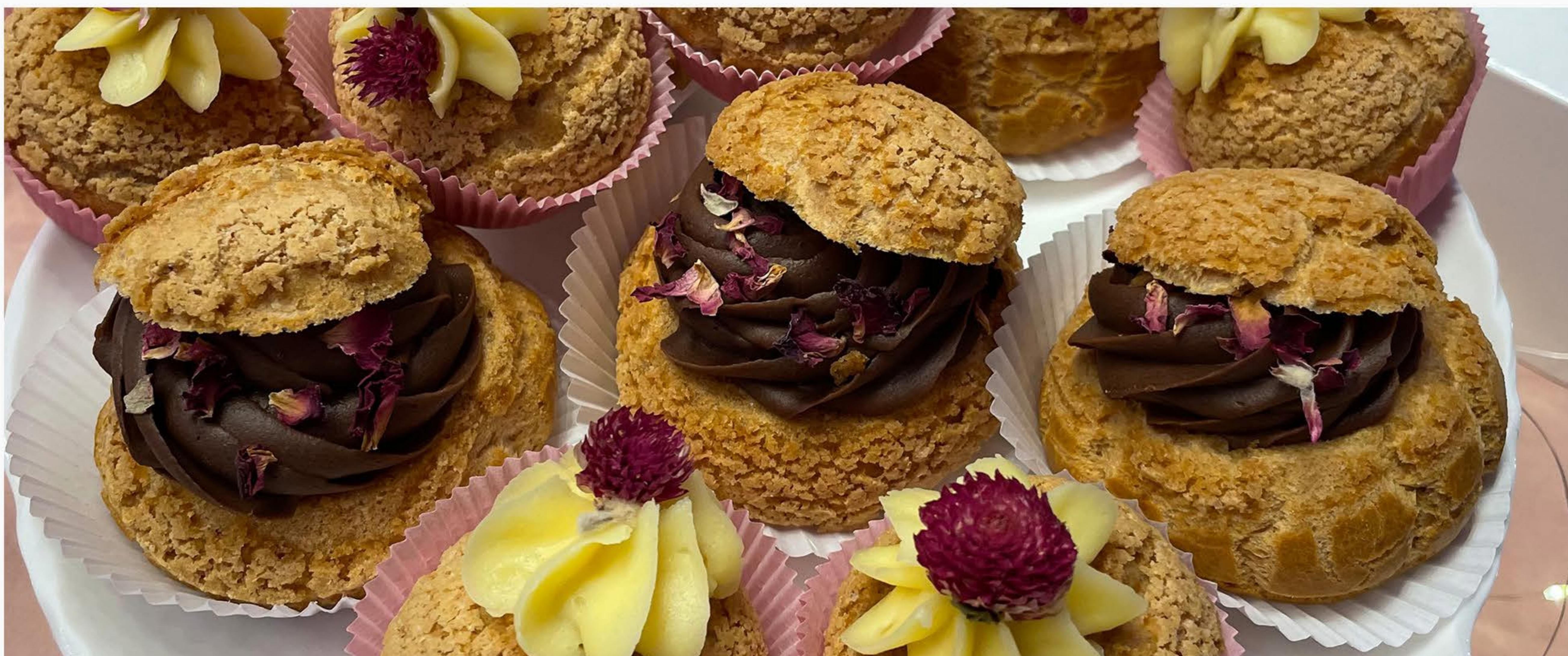
PTYŚ WERSJA CZEKOLADOWA I ŚMIETANKOWA