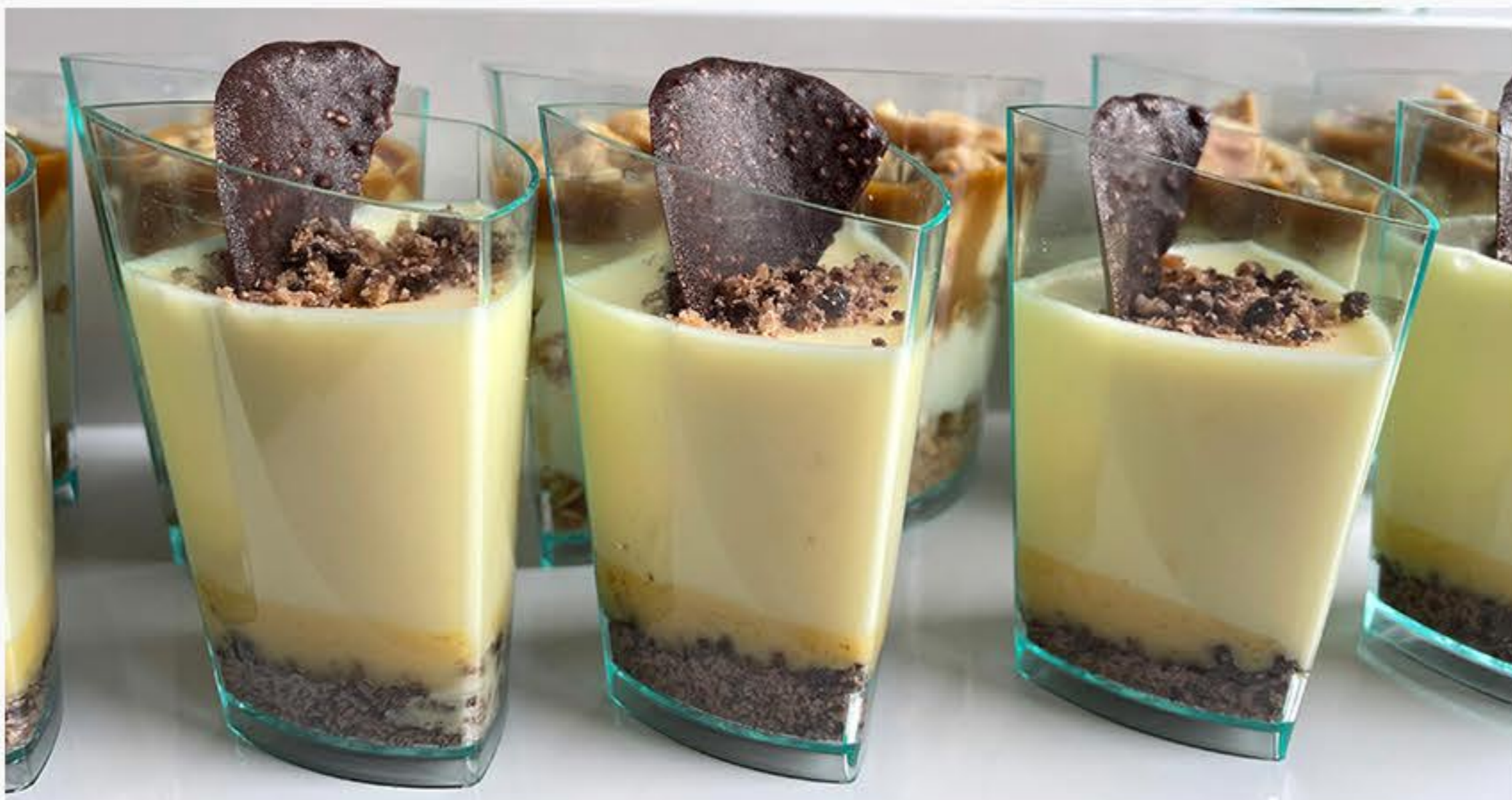
ADWOKATKA Z POMARAŃCZĄ