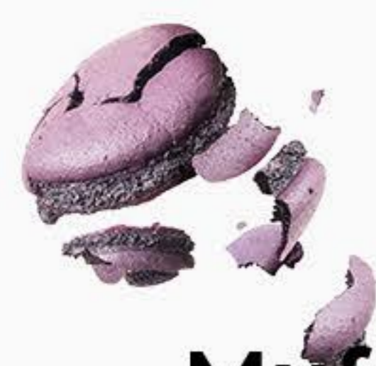
Muffin z kremem maślanym

(czekoladowe, jogurtowe, piernikowe i marchewkowe)