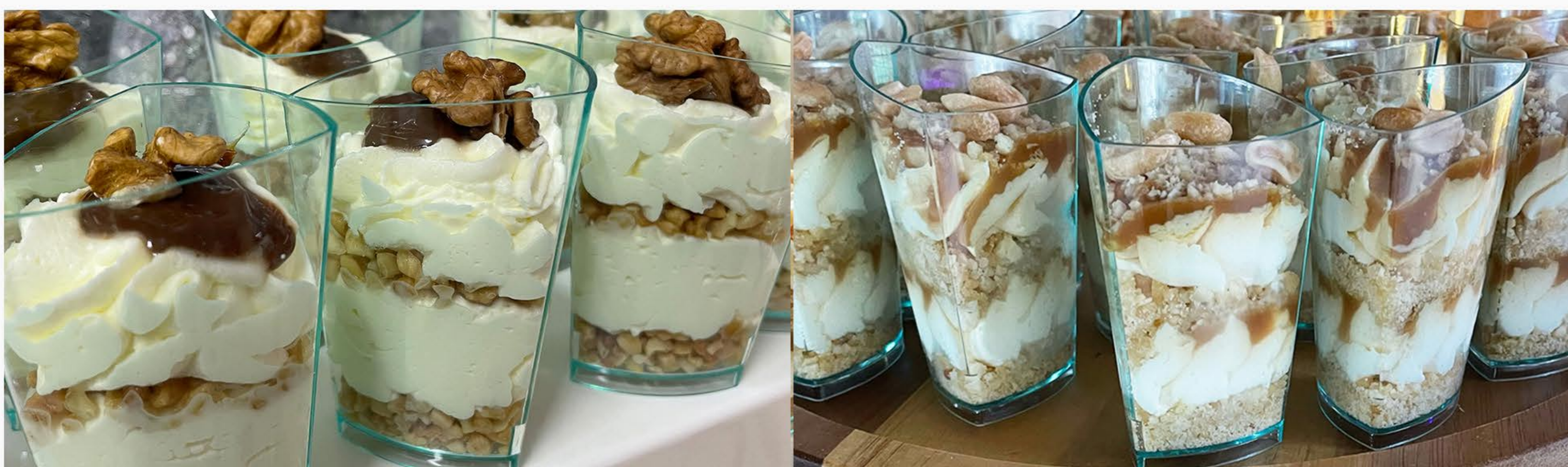
SŁONY KARMEL Z MASCARPONE I ORZESZKAMI