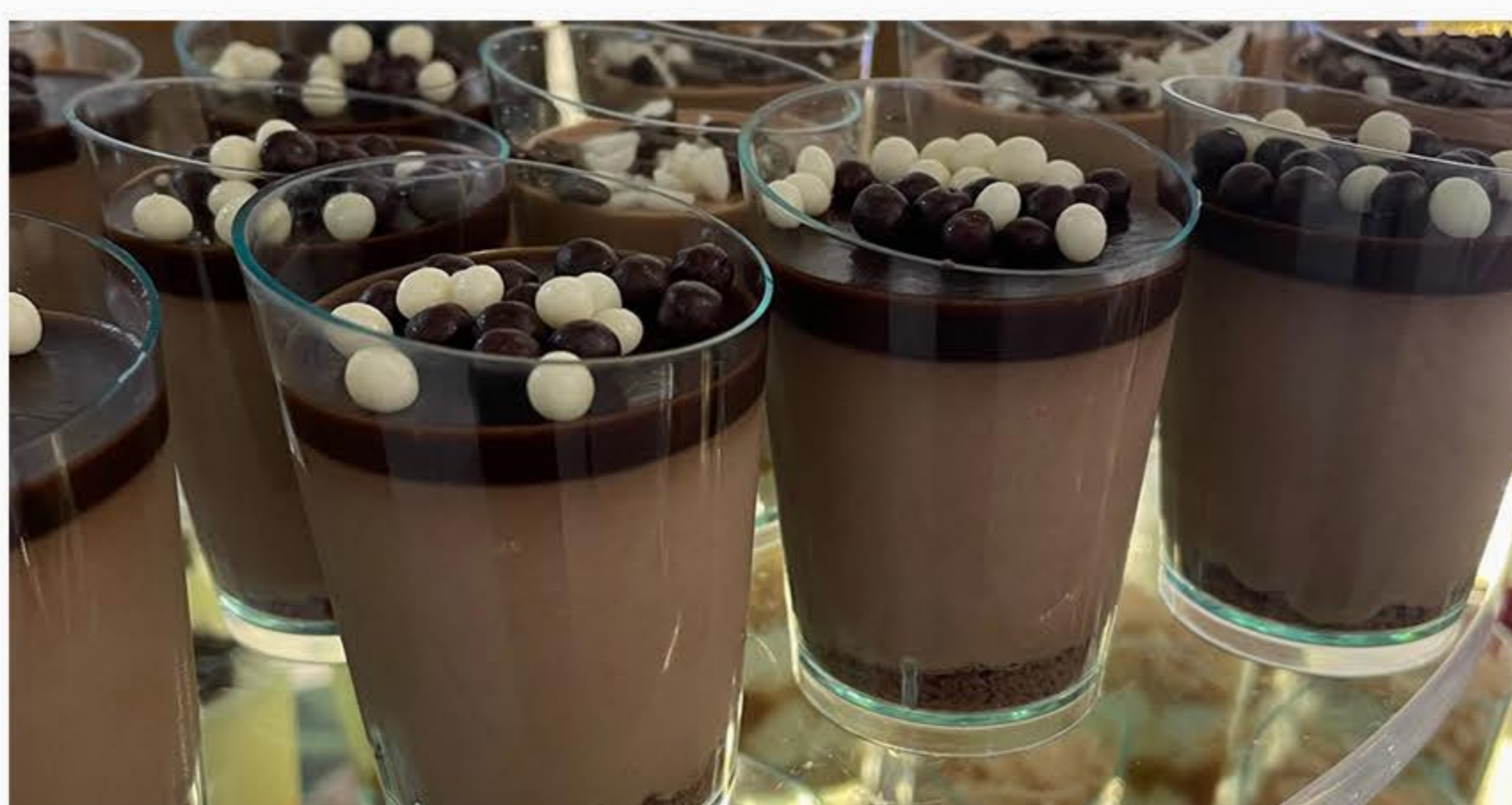
MUS CZEKOLADOWY Z POLEWĄ ORZECHOWĄ