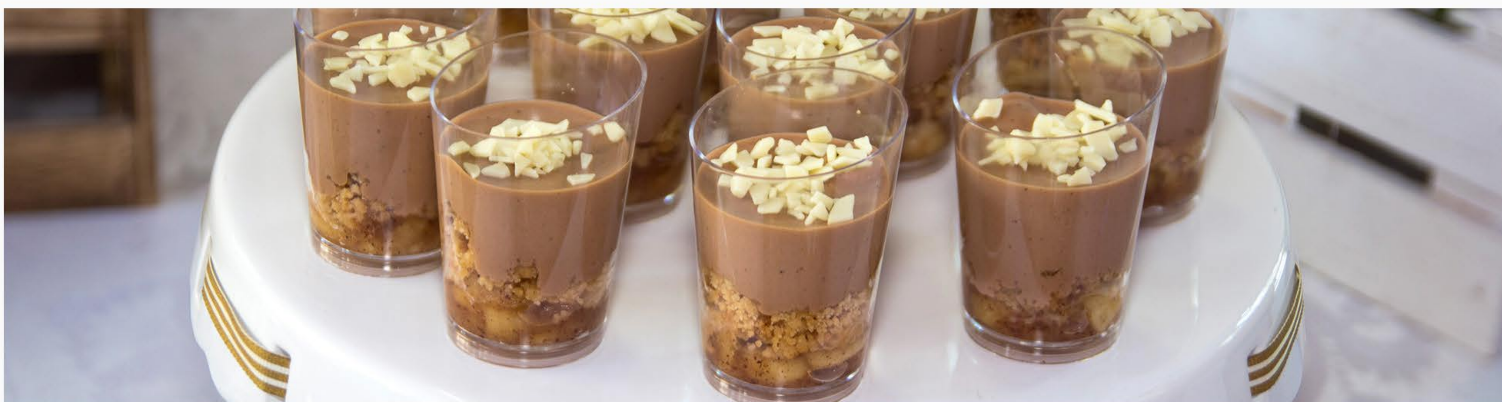
MUS CZEKOLADOWY Z CYNAMONEM I PRAŻONYM JABŁUSZKIEM