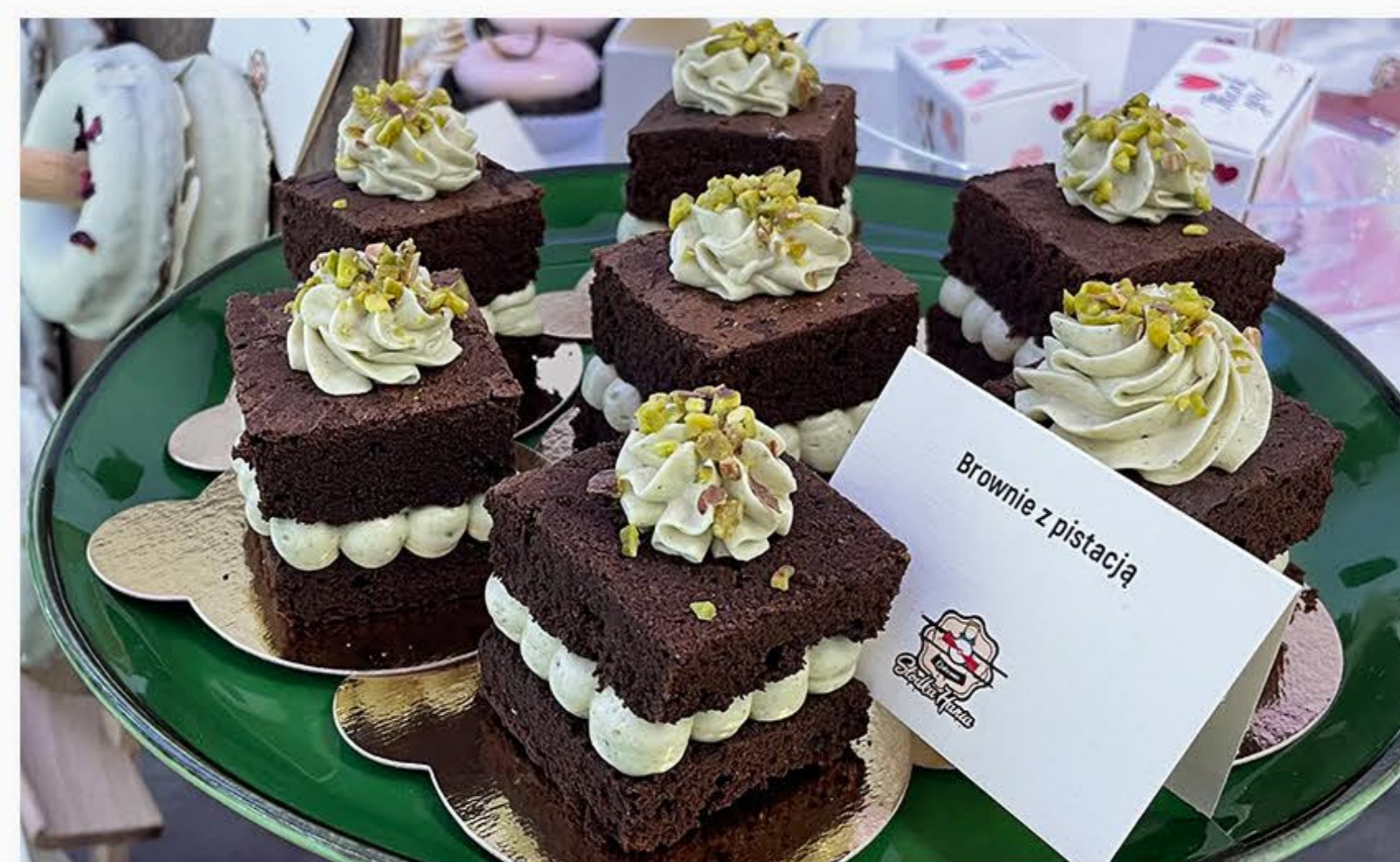
BROWNIE Z PISTACJAMI 10zł/100g