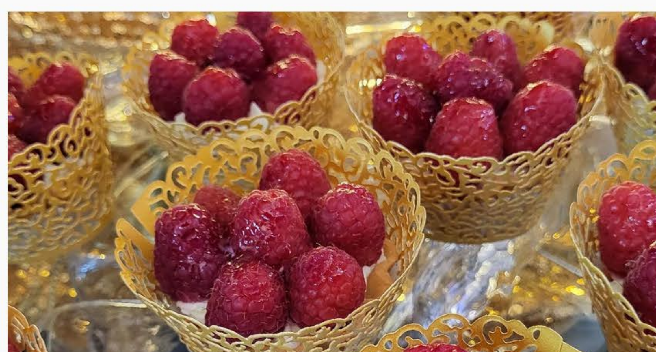
MASCARPONE Z MALINAMI