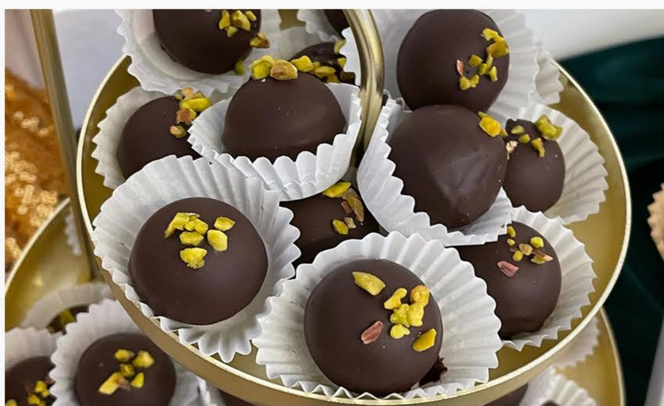
PRALINKI PISTACJOWE 12zł/100g