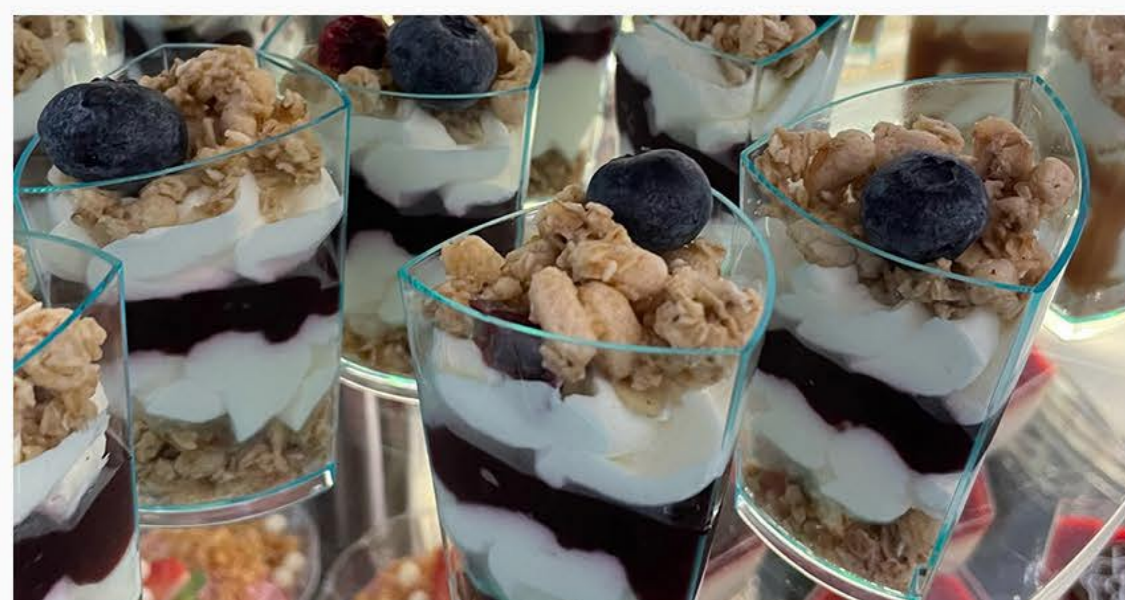
ŚMIETANKA Z MASCARPONE I CZARNĄ PORZECZKĄ