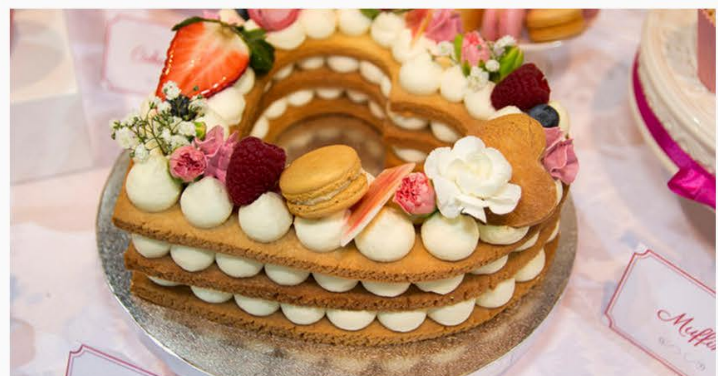
KRUCHE Z MASCARPONE I OWOCAMI