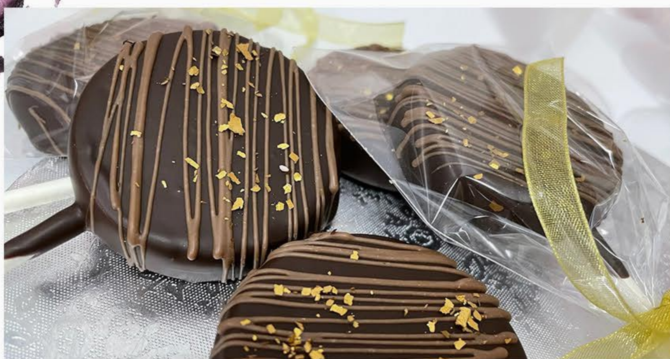
CHRUPAK W CZEKOLADZIE