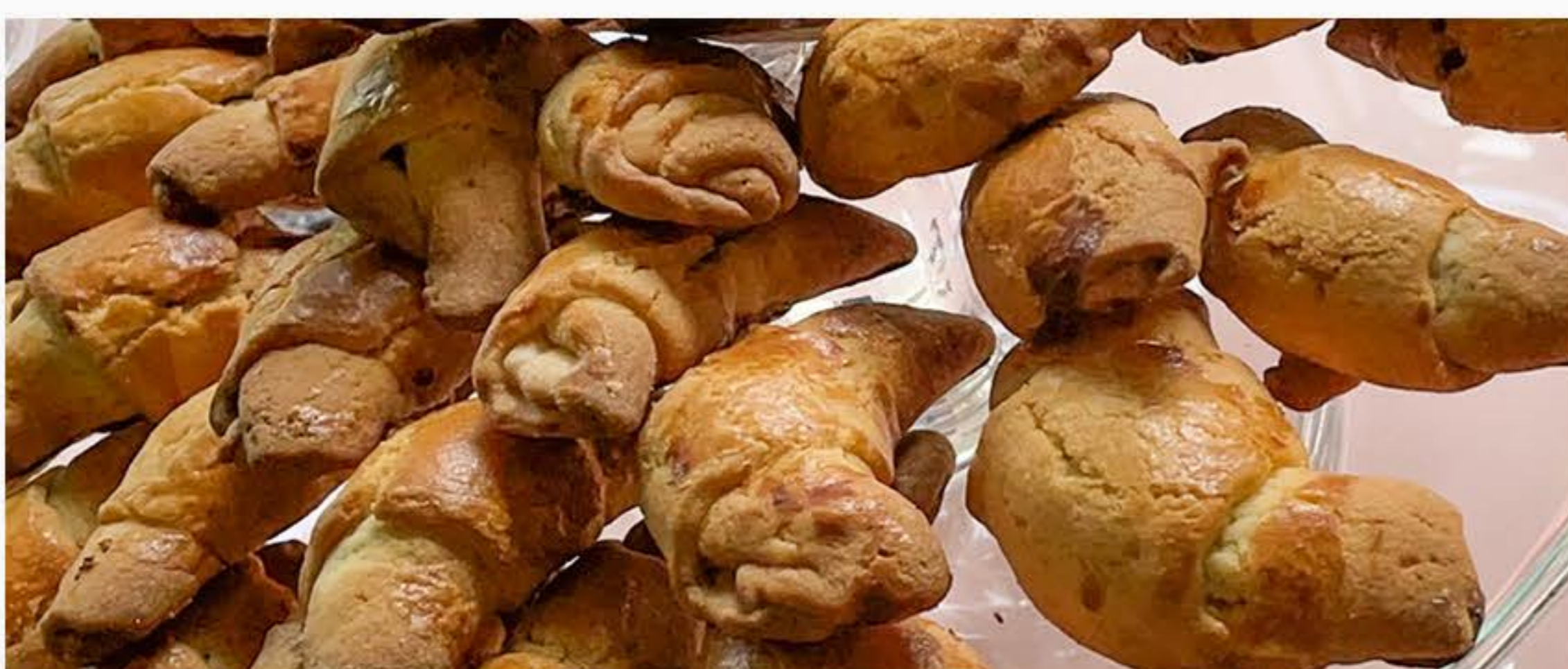
ROGALIKI KRUCHE Z PORZECZKĄ