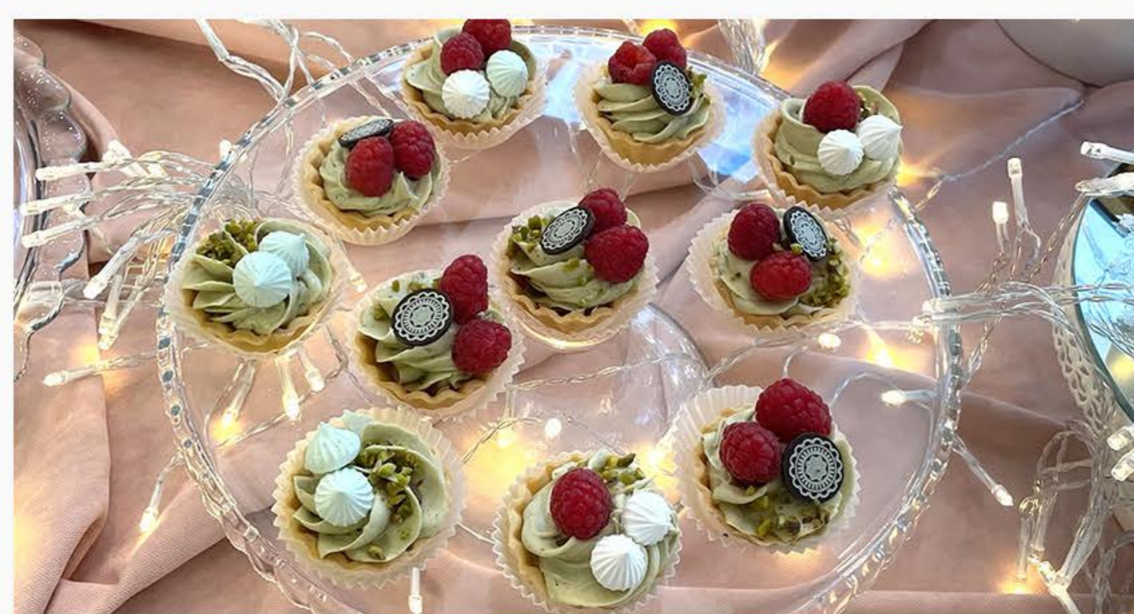
TARDALETKA Z PISTACJĄ (45MM)