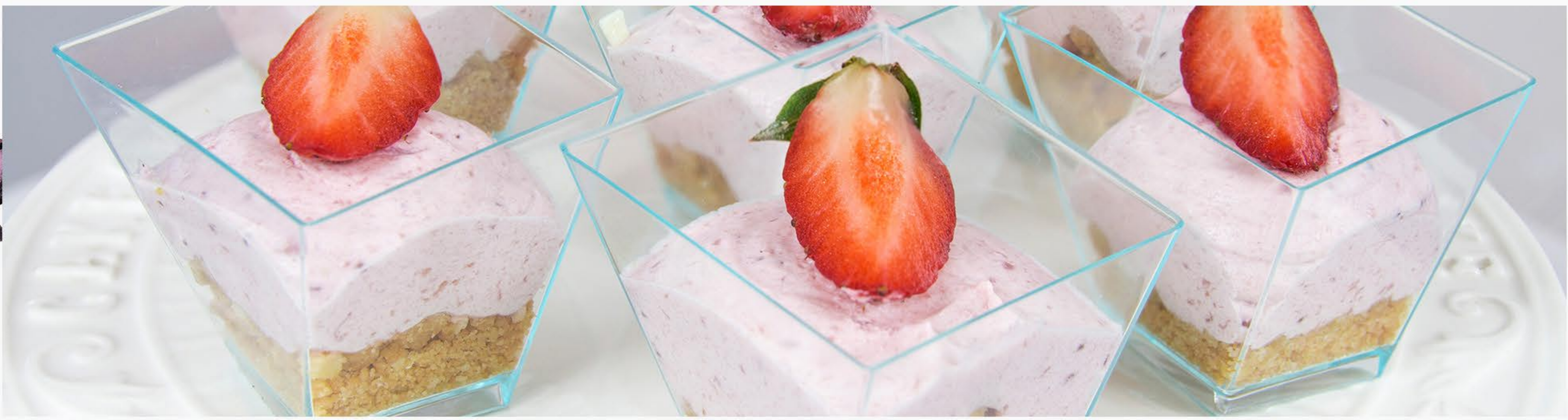
MUS OWOCOWY Z MAŚLANĄ KRUSZONKĄ