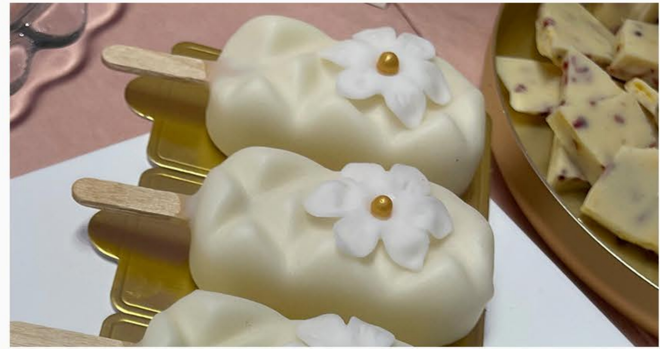
LIZAK MUS OWOCOWO-CZEKOLADOWY