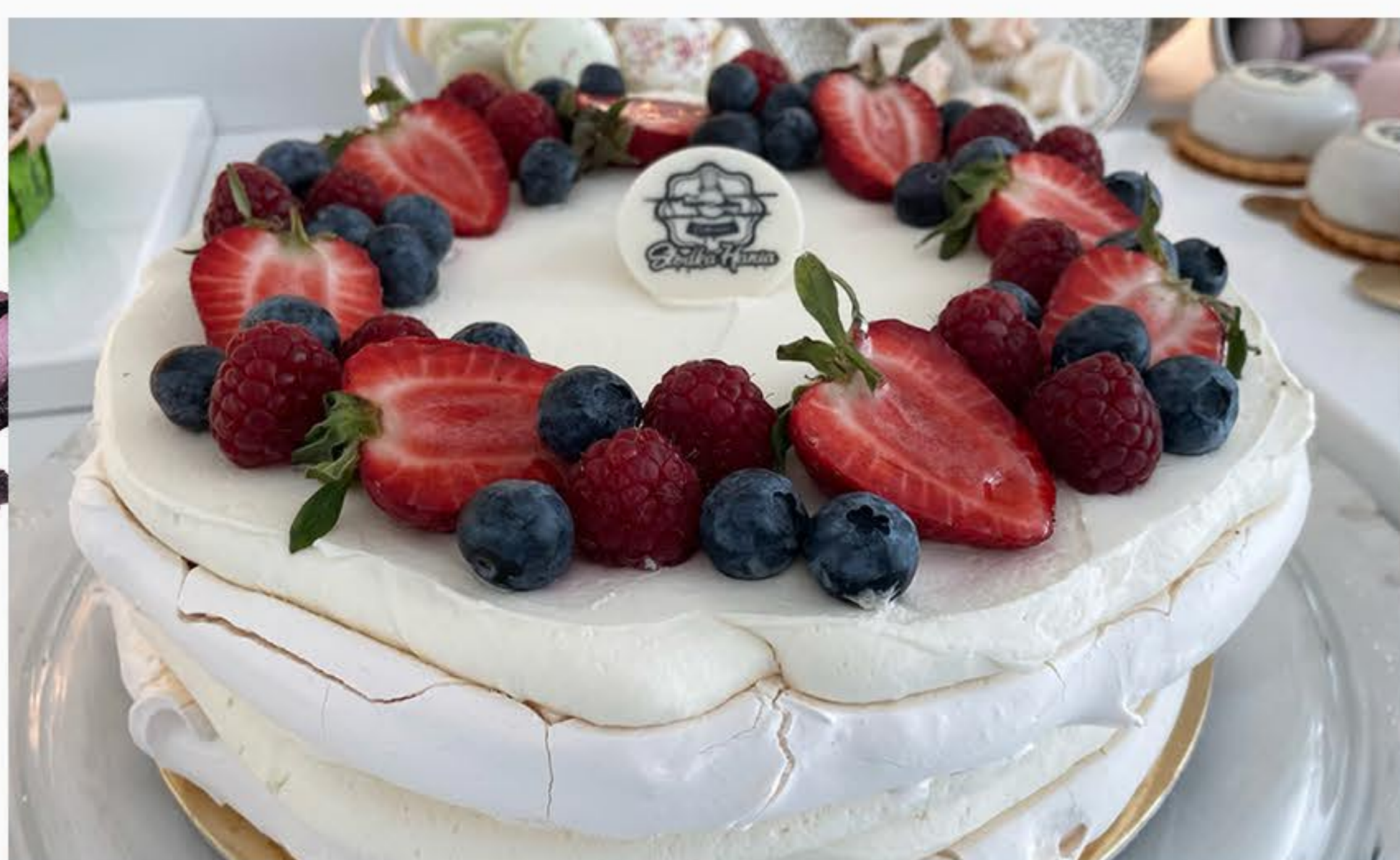
TORT BEZOWY Z MASCARPONE I OWOCAMI 110zł/kg